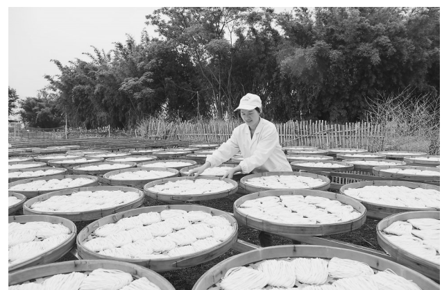
近日，在信丰县古陂镇，村民正在晾晒手工面。据了解，古陂手工面是当地一项特色产业，也是当地一道特色美食，长期以来一直畅销市场。

本报高安讯（通讯员况文欣）近日，《中共中央 国务院关于促进民营经济发展壮大的意见》（以下简称《意见》）发布，高安市工商联联系实际，立足本职，以务实举措推动《意见》在高安落地，激发民营经济发展新动能。 高安市工商联持续开展“人企走访连心”活动，积极为民营企业送政策上门，讲解惠企新政策。引导民营企业用好参政议政通道，引导民营经济代表人士围绕《意见》落地落实积极建言献策，推动惠企政策研究和落实。同时，优化营商环境，切实维护民营企业合法权益。建立“1+7+N”非公维权服务模式，即由非公维权服务中心召集，7个有关部门报到，相关涉企“N”个部门加入，打造“民企港湾”，开通非公维权绿色通道，实现“零障碍”沟通。还搭建企业家微信交流群、营商环境三级监测体系、“高诉平APP”等政企沟通平台，建立涉企诉求闭环解决机制。截至今年7月，解决企业诉求300余个，回访办结满意率达100%。 此外，该市工商联持续深入开展“法律三进”“法治体检”“万所联万企”活动，强化法律政策宣传，为67家民营企业进行“法治体检”，排查风险27个，化解矛盾15个。动员商会积极参与“万企兴万村”行动，村企结对帮扶，助力乡村振兴。截至目前，共为村民提供岗位300余个，相对于去年增加了20%。