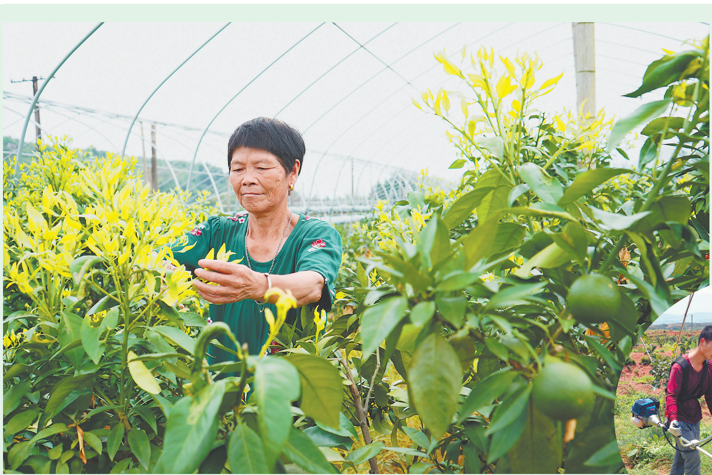
▲8月9日,分宜县操场乡山河村果冻橙种植基地,农户正在修剪果树。近年来,分宜县积极调整农业种植结构,引导农民发展西瓜、蜜橘、果冻橙等特色种植产业,通过打造“一乡一业”“一村一品”,助推乡村振兴。

段茜茜表示,东湖意库的IP矩阵里,可以看见未来链接一切内容的可能:文创市集、艺术展览、婚庆party、话剧表演、音乐现场、电影基地、直播带货、社群活动、VR场景……最终形成人文艺术生态圈。