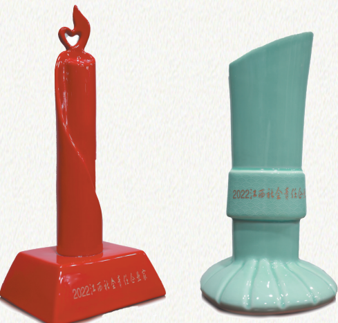
2022江西社会责任企业(企业家)奖杯