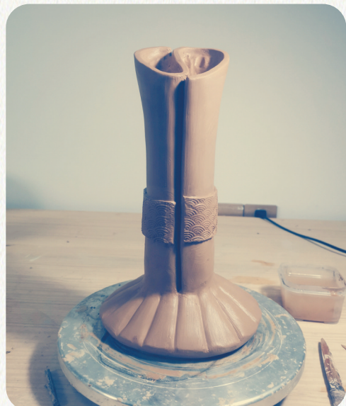
2022江西社会责任企业奖杯泥稿