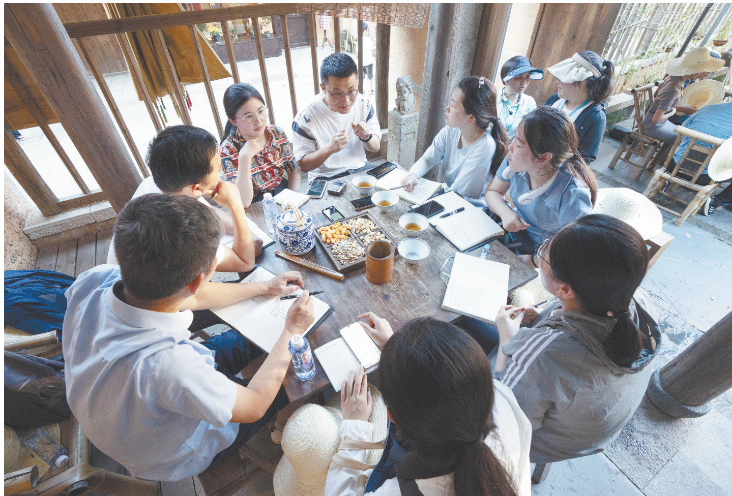
7月10日,采访团记者在上饶市广信区望仙谷与景区运营中心负责人座谈。