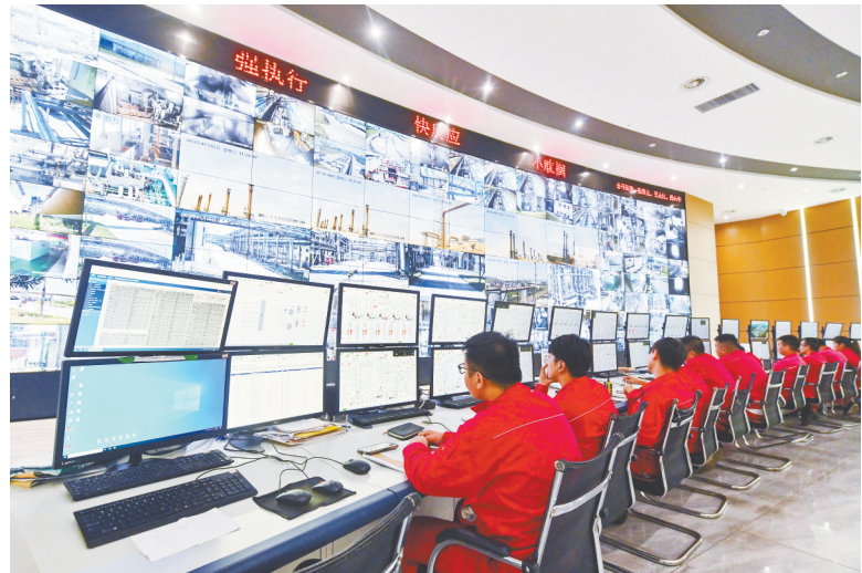
7月12日,位于高安县的济民可信清洁能源有限公司中央控制室,工作人员正在对整个联合装置进行精准调控,保障系统的运转平稳。