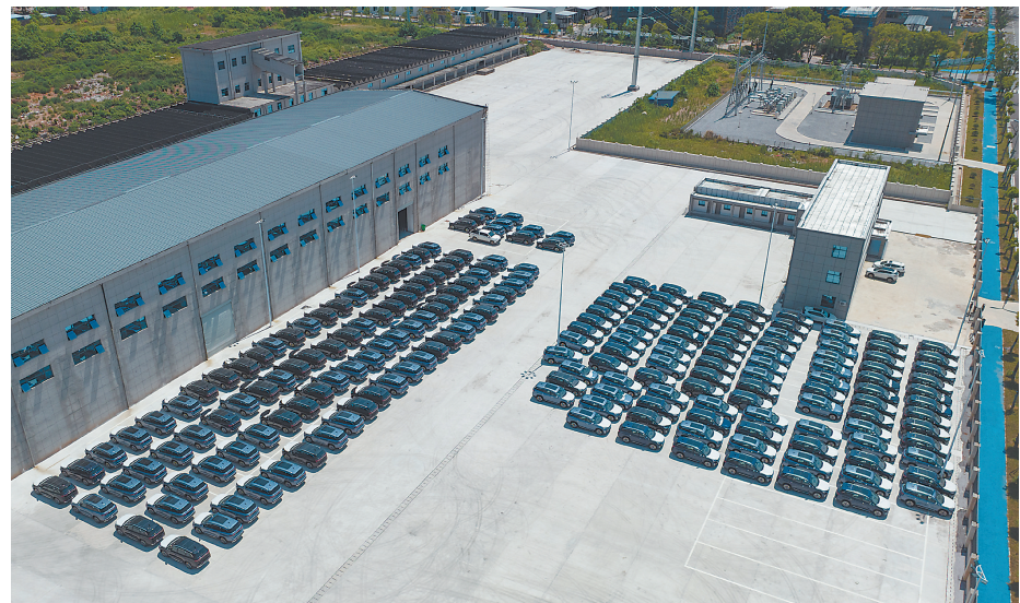
7月12日,大批新车在鹰潭国际陆港国内仓等待装车。