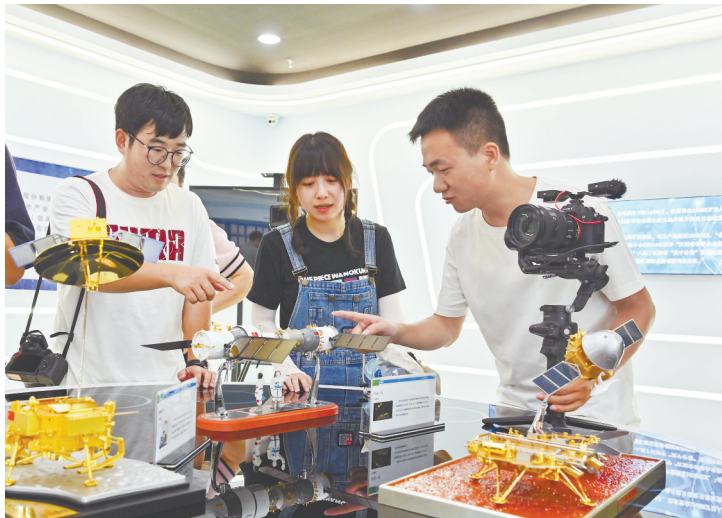
7月10日,在南昌凯迅光电股份有限公司产品展示车间内,人民网江西频道记者(右)与江西广播电视台记者察看应用了该公司产品的航天科技装备模型。