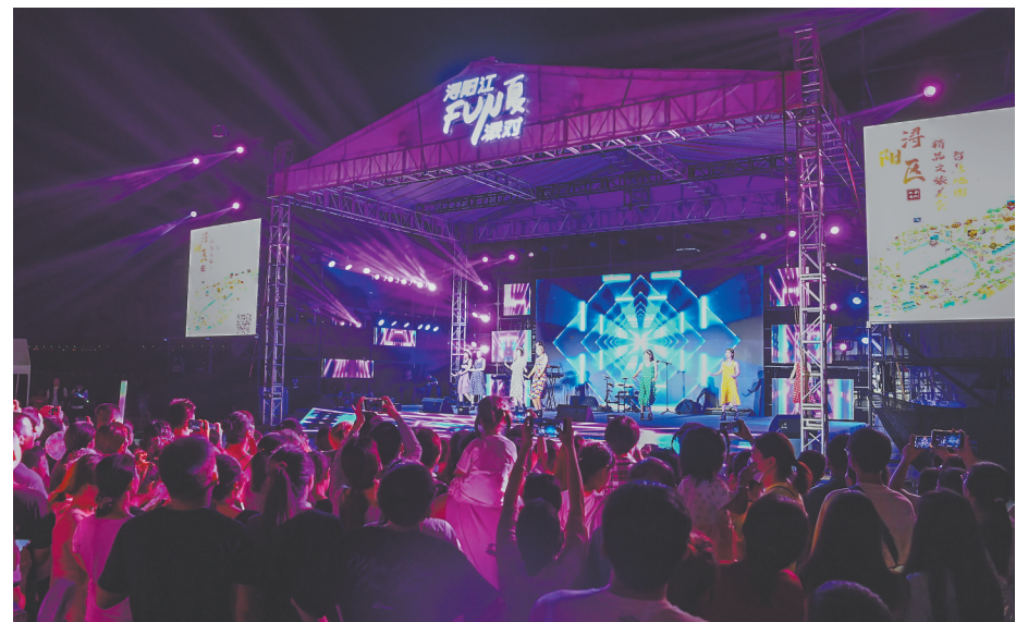
7月14日,九江市浔阳区精品文旅音乐派对演出,掀起文旅消费新热潮。