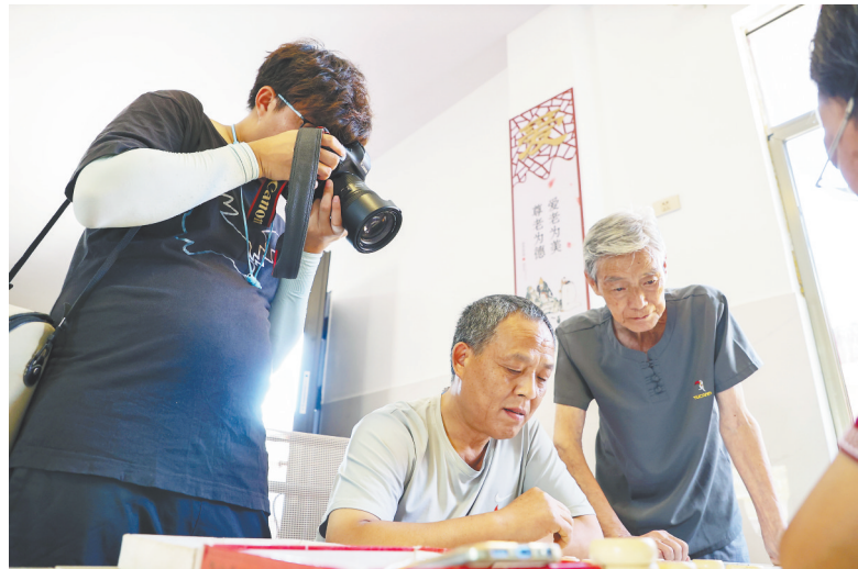
7月21日,新余高新区水西镇桐林村颐养之家,中新社江西分社记者在拍摄老人的幸福生活。