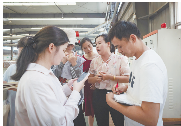
7月14日,采访团记者在位于资溪县的江西竺尚竹业有限公司了解竹木制品的生产过程。

大家用手中的笔和镜头,以各种不同的媒介传播手段,精心推出图文、VLOG、微动漫、H5等形式多样的融媒体报道,集中展现江西高质量发展的生动实践。