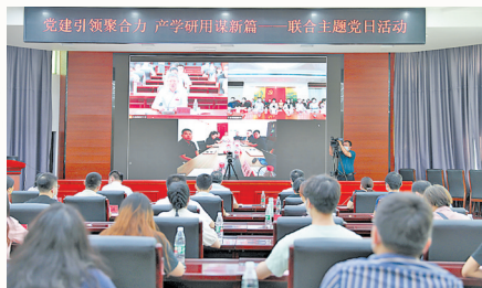
环境与化学工程学院与教育部国际司党支部联合开展“党建引领凝聚力”主题党日活动

南昌航空大学以习近平新时代中国特色社会主义思想为指导，深入贯彻落实党的二十大精神，聚焦“作示范、勇争先”的目标要求，紧紧抓住立德树人根本任务，加强和改进党对高校的领导，突出思想引领，夯实党建基础，强化育人实效，为党的建设和思想政治工作注入“源头活水”，奏响高校党建工作的多彩乐章。