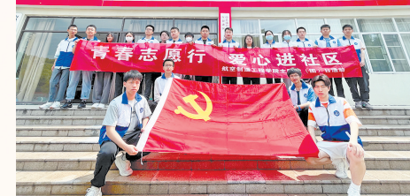
航空制造工程学院开展“青春志愿行 爱心进社区”主题党日