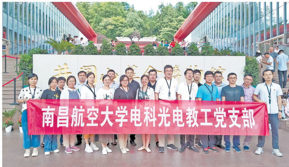
测试与光电工程学院电科光电教工党支部开展红色研学实践活动