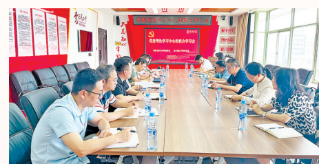
航空制造工程学院和环境与化学工程学院开展党委理论学习中心组联学联研学习会

育才造士，为国之本。南昌航空大学坚持党对教育工作的全面领导，坚持立德树人根本任务，坚定不移推动高质量发展，培养德智体美劳全面发展的社会主义建设者和接班人，在以中国式现代化全面推进中华民族伟大复兴的进程中，在全力助推我省经济社会高质量发展中，展现更大作为、创造新的辉煌。