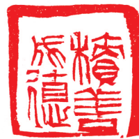
篆刻《积善成德》 陈维刻