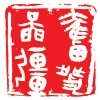
篆刻《春发图强》 余圣华刻