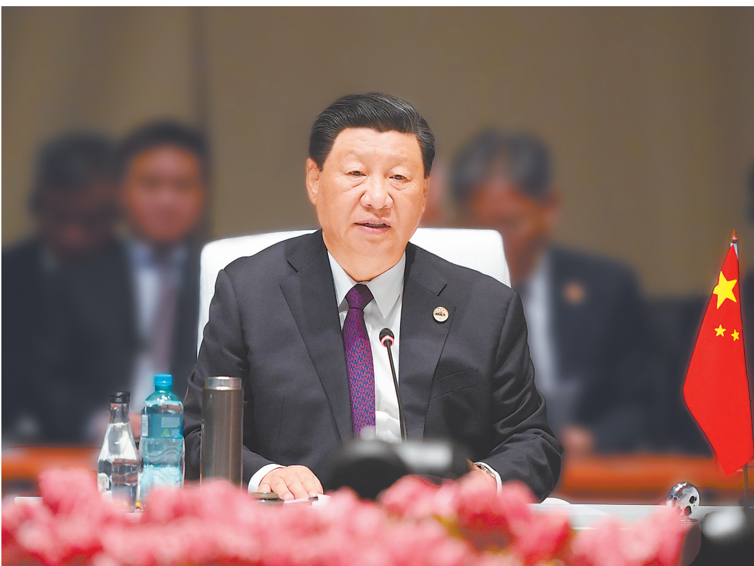
当地时间8月23日上午,金砖国家领导人第十五次会晤在约翰内斯堡杉藤会议中心举行。南非总统拉马福萨主持会晤。中国国家主席习近平、巴西总统卢拉、印度总理莫迪和俄罗斯总统普京(线上)出席。习近平发表题为《团结协作谋发展 勇于担当促和平》的重要讲话。

强调秉持开放包容、合作共赢的金砖精神,以金砖责任应对共同挑战,以金砖担当开创美好未来