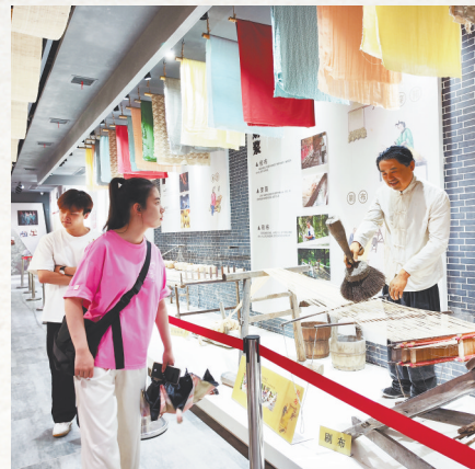
游客在分宜麻博物馆参观

走进修缮一新的山背遗址公园,如诗如画,一大片清碧莹透、含苞待放的荷塘仙葩令游客兴奋异常。中华文明源远流长、波澜壮阔,留下了无数璀璨的文化遗产。山背遗址公园通过多种展示手段,将山背文化转化为听得懂、讲得明的“中国好故事”传递给大众,进而有助于人们更好地理解中华文明起源演变的复杂图谱,更好地回答“我是谁”“我从哪里来”“我要到哪里去”等人生思考,进一步坚定我们的文化自信。