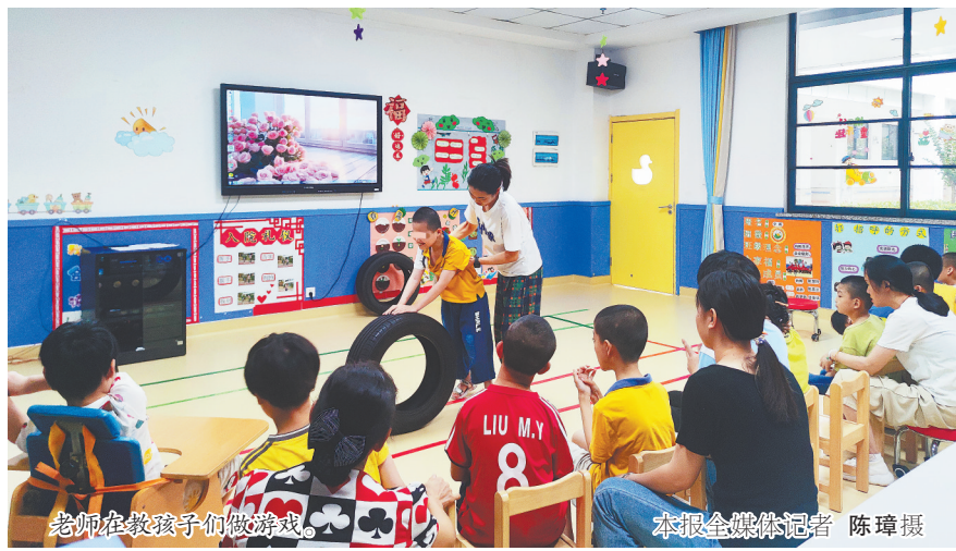
老师在教孩子们做游戏。

本报全媒体记者 陈璋 邮箱:65204228@qq.com 电话:0791-86847355