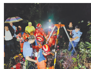
救援现场。

本报讯(全媒体记者侯艺松)8月28日20时许,芦溪县上埠镇上埠村一村民来到芦溪县公安局上埠派出所求助,其父亲王某当天中午骑摩托车外出未归,电话关机。民警通过研判,确定了王某活动范围。此时已是第二天凌晨,民警召集志愿者连夜寻找,终于在附近山腰处一个深10余米的废弃天井里发现王某,但由于井太深,无法实施救援。民警一边安抚王某情绪,一边拨打救援电话。随后,民警协助赶到