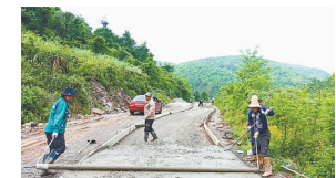
路面施工现场。

本报讯(易永艳)“土路成了水泥路,下雨天出行更安全了。”近日,瑞昌市横立山乡新村村村民洪看着村里焕然一新的道路,喜上眉梢。