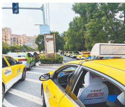
排队等候加气的出租车。

中石化加气站工作人员告诉记者,该站加气设备比较陈旧,出于安全考虑,满负荷运转只能承担9000立方米天然气的加气量。部分车辆气改电后,实际需要用的车辆约470辆,在车辆不开空调的情况下,9000立方米能满足需求,但七八月