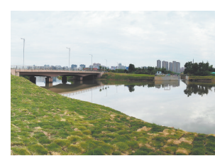
新建的渠道闸门。

本报讯(全媒体记者朱雪军 通讯员程祈才)8月30日,记者从南昌市政开发集团获悉,南昌市象湖污水处理厂收集范围排水单元改造及水环境提升工程日前完工,生活污水收集率得到提升,周边河湖水质有明显改善,水更清、岸更绿、景更美,惠及周边90多万居民。