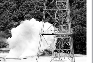
一箭三星！我国成功发射遥感三十九号卫星

征集活动按照发布公告、初步评选、网络投票、最终评选和结果公布5个环节组织实施，所有热爱中国载人航天事业的自然人、法人及组织均可参与。中国载人航天工程办公室将为最终入选方案作者颁发纪念证书，并安排赴发射场观摩载人航天发射任务。