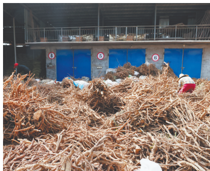
晾晒中药材。

提高了资源利用率,还不要租赁田地,减少了租金投入,杂草也没有容身之地,可谓是一举多得。”乐平市林业局产业股股长负责人介绍,该市依托财政补助资金,开展示范创建,培育扶持了一批规模大、效益好、带动力强的林下经济示范基地和示范点,引导农户加入林业合作社,实现共同增收致富。目前,该市共建成省级林业龙头企业2家,高标准林下经济示范点3处,辐射带动林下经济示范点10