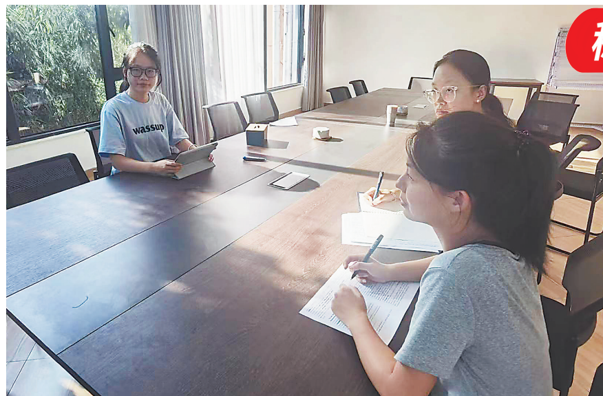
江西师范大学的众创空间内,创业者在办公。