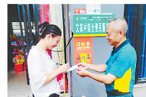
村民在物流服务站收快递。

本报讯(全媒体记者付强)“以前购买大件商品要去集镇或县城,现在村里有了电商物流服务站,送货上门方便省心。”日前,安福县寮塘乡思塘村村民李女士向江西新闻客户端“党报帮你办”频道表示。近年来,安福县交通运输局大力推进农村交通物流网络节点建设,累计发放120万元奖励补助资金,设立116个县、乡、村三级物流体系服务网点。同时,利用乡镇100%公交优势,打