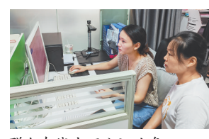
群众在线办理公证业务。

为提升服务水平、满足群众需求,新建区司法局不断深化公证机构改革,新建公证处积极借助南昌市豫章公证处提供的远程视频办证平台、网络申办平台、电子证