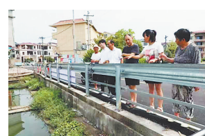
巡察组干部在排查沟渠。

近日,安义县委巡察组对乡村内涝问题进行全面排查,共发现因内涝问题引起的原因引起的内涝问题11件,导致60余亩农田被淹。巡察组向有关村“两委”反馈并下发