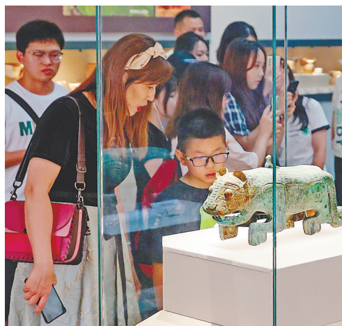
8月30日,游客驻足观看商代伏鸟双尾青铜虎。本报全媒体记者 洪子波摄

如今,在省博物馆,从商代伏鸟双尾青铜虎化身而来的小鸟虎,已经是一个非常受欢迎的IP,它拥有小鸟虎系列文创产品,小鸟虎雪糕更成为到馆必买的网红产品。2022年6月1日,面向儿童推出的首个主题展——“寻·虎—小鸟虎儿童主题展”更是以灵活有趣的方式,让这个来自商代的青铜器成了主角。