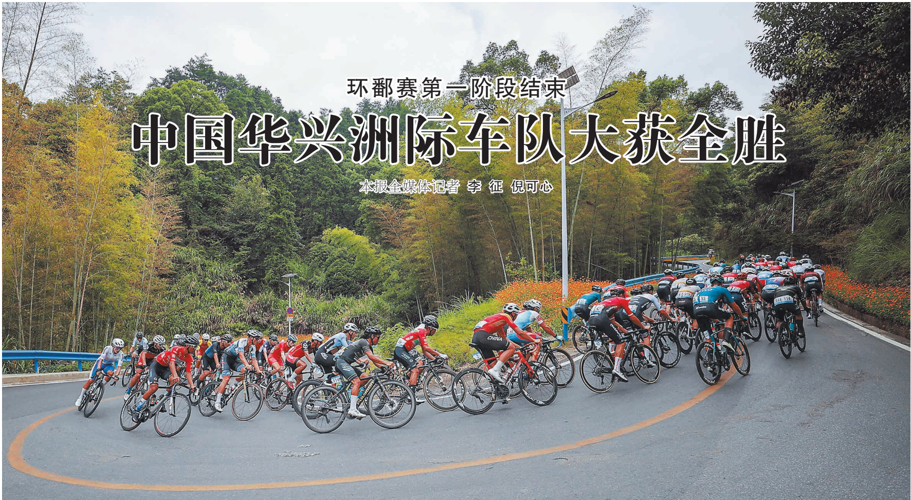
9月12日,第十一届环鄱阳湖国际自行车大赛第五站在南昌湾里举行。