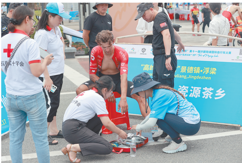
9月11日，环鄱赛志愿者联络医护人员为受伤的选手清理伤口。

高温之下，身穿厚实的骑行服骑行无疑是一场严峻考验。30名来自中国秋然摩托团队的摩托骑手在“上烤下蒸”的马路上灵活穿梭，