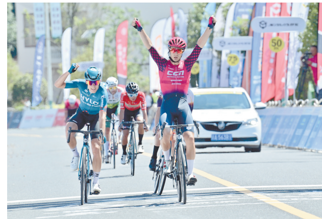
选手冲刺瞬间。

作为亚洲影响力较大的品牌赛事之一,环鄱赛已不仅仅是一项体育活动,更是江西体育、文化和旅游产业联动发展的一条重要纽带。刘钢表示,我省体育部门不仅要推动环鄱赛向国际自行车联盟更高赛事级别迈进,也要继续发挥环鄱赛综合效应,进一步加强与文化、旅游、娱乐、互联网等相关行业的业态融合发展。