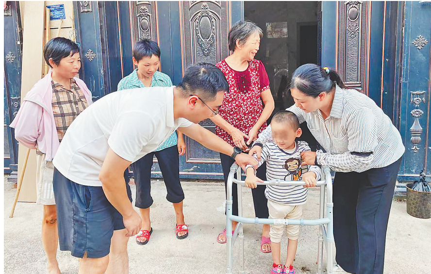
小伟接受康复训练后可以借助辅助工具行走。

本报全媒体记者 陈璋 邮箱:65204228@qq.com 电话:0791-86847355