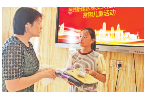
给学生发放学习用品。

本报讯(全媒体记者徐黎明)“师生都收到了爱心人士送来的暖心物资,非常开心。”南昌市新建区大塘坪客户长胜小学校长向江西新闻客户端“党报帮你办”频道反映,民进新建区总支的会员们日前来到该校开展爱心捐赠活动,让大家感受到了温暖与关爱。当天,会员们将书包、文具盒、笔记本、课外