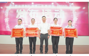
公益受助单位领取资助牌。

去年,江西福彩始终坚持党的领导事业发展的政治责任,促进党建与业务工作融合发展,积极履行筹集公益金的经济责任,严格遵守依法合规的法律底线,确保江西福彩事业安全运行、健康发展;遵循福利彩票“扶老、助残、救孤、济困”的宗旨,安排省本级和中央专项福利公益金2.85亿元,用于支持社会福利、社会公益、乡村振兴等领域事业发展。