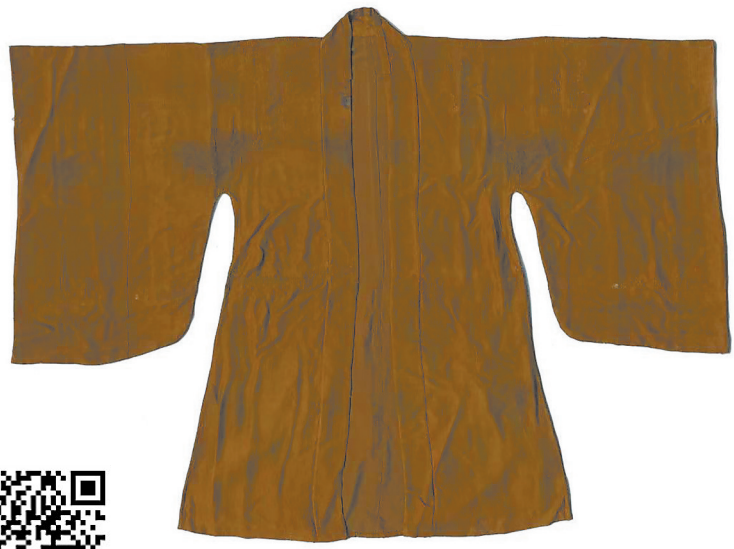
修复后的南宋丝绸服饰。

据介绍,丝绸文物是蛋白织物,对温度、湿度要求严格,保存不易。由于南方气候潮湿,不利于丝绸文物的保存,加上这批珍贵的丝绸文物出土已有35年,有的出现霉斑、虫蛀、碳化、残缺、发脆等问题,需要对其进行进一步修复保护。为此,德安县博物馆分别于2017年、2022年开展了南宋周氏墓出土丝绸服饰保护修复一期、二期工作,共修复南宋丝绸服饰9件。与以往