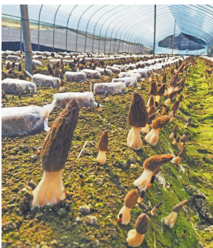
搭建大棚种植羊肚菌。