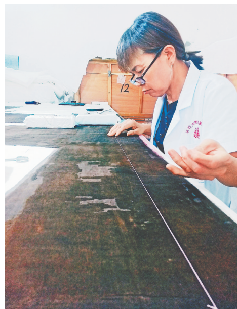
文物修复专家在对南宋丝绸服饰进行修复。