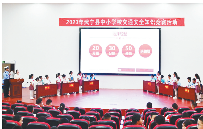
近日，武宁县公安局交警大队、县教育局在武宁县第八小学举办全县中小学校交通安全知识竞赛决赛。来自全县6组中、小学决赛代表队队员们斗智斗勇、尽情发挥，在决战决胜的赛场上你争我抢、一决胜负，积极完成交通安全知识必答、抢答和风险题的决赛过程挑战。经过激烈角逐，县第五小学、县第二中学分别获得本次比赛活动小组和中学组团体一等奖。