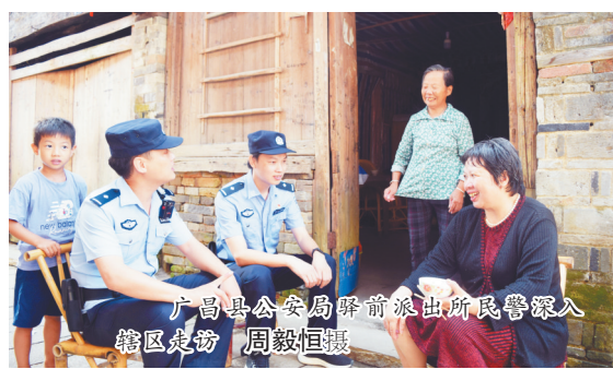
广昌县公安局日前派出所民警深入辖区虎坊

“小事情不化解，后期可能激发大矛盾。”按照“派出所主防”定位，广昌县12个派出所主动与乡镇政府、社区居委会、村委会对接，创建“社区主导、公安搭台、多方参与”的矛盾纠纷化解格局。