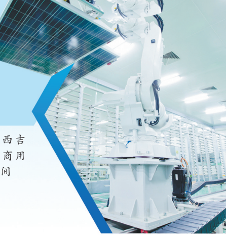
晶科能源自动化生产线

面融入长三角一体化发展充分彰显江西东大门的生机活力的实施意见》,加快全面对接融入长三角,全力推动高质量发展。