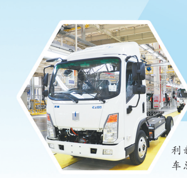
江西吉利新能源商用车总装车间

与上饶经开区共成长的晶科能源,其年营收已突破千亿元大关。全国工商联本月发布的相关榜单显示,晶科能源控股有限公司以年营收1110.65亿元的实力,位列2023中国民营企业500强第83位、2023中国制造业民营企业500强第52位。晶科能源产品远销全球上百个国家及地区,已经成为全球最大晶硅光伏企业,拥有光伏全产业链生产体系,在国内外共建有14个生产基地,正在上饶经开区扩建的第6期、占地规模达1178亩的智