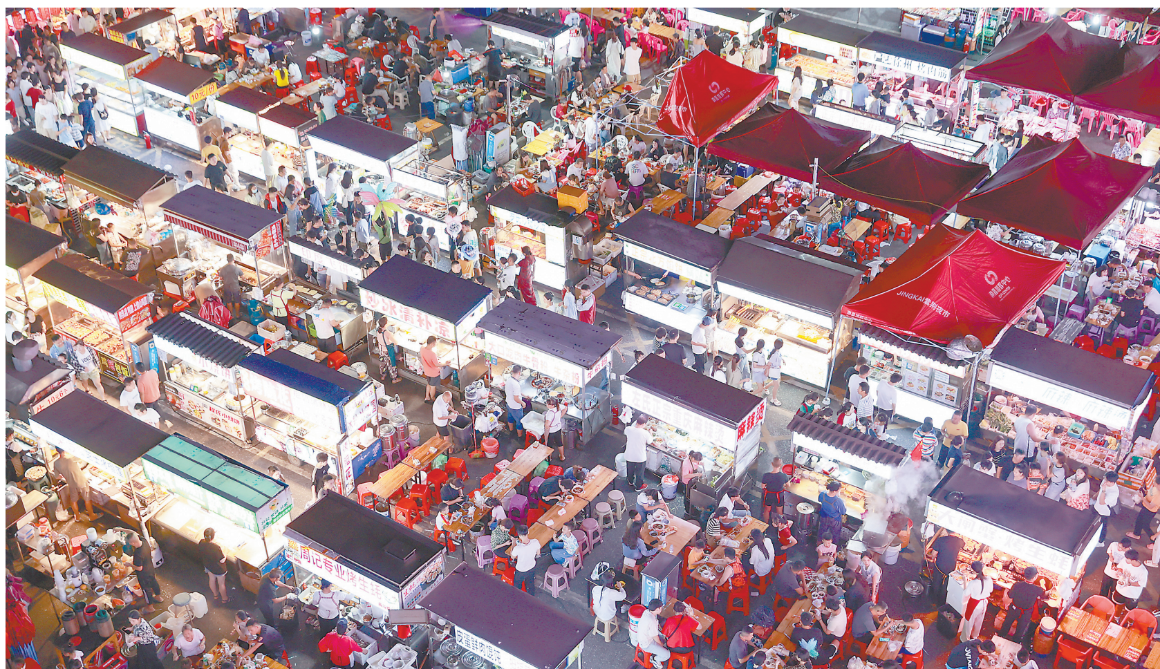
近日,南昌经开区紫荆夜市人声鼎沸,游客漫步其中品尝美食,享受假期。