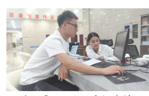
工作人员协助企业申报资料。

本报讯(易永艳)“经过镇干部的解读，我对申报科技型中小企业的办理流程 and 优惠政策有了全面了解。”日前，丰城市泉港镇辖区一企业相关负责人向江西新闻客户端“党报帮你办”频道表示。近日，丰城市泉港镇镇委通过走访了解到，辖区部分企业对申报科技型中小企业的流程不熟悉，对部分优惠政策不甚了解。该镇镇委立即督促镇科技办全面摸