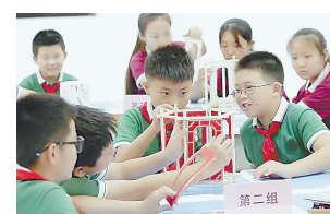
学生在制作走马灯。

活动中，学生们按照制作步骤组装、裱糊、固定……不起眼的手工材料经过制作、装饰后，变成了精致的走马灯。孩子们手提花灯，争相展示自己的“劳动成果”。通过此次活动，孩子们了解了走马灯的历史，沉浸式体