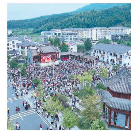
中源乡吸引了大量游客。

中源乡通过搭建数字化信息平台，有效破解乡村基层治理中的管理难、办事难、互动难问题。记者在乡客家居避暑特色小镇综合治理中心看到，全乡各处公共场所的实时画面都在一块大屏幕上呈现。该屏幕可实时反映车流量、停车位、公共厕所的数据，如果游客遇到困难，可在“爽爽中源”微信公众号上发送求助信息，后台工作人员会立即处理。