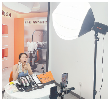
将车间改造成直播间。