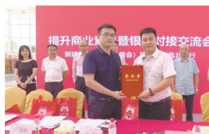
签署战略合作协议。

本报讯(全媒体记者徐黎明)“新建区工商联召集企业和金融机构齐聚一堂谋发展，让我们了解到很多支持民营企业的金融政策。”近日，南昌市新建区一家农业公司负责人向江西新闻客户端“党报帮你办”频道反映，通过区工商联“搭台”、银企“唱戏”，分享金融政策，激发了民营经济发展动力，引导更多“源头活水”流向实体经济。在银企对接活动现场，