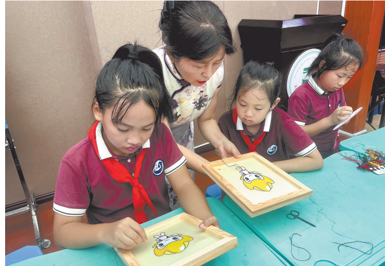
老师向学生讲解豫章绣的针法要领。