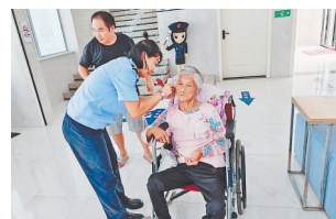
工作人员在为老人提供服务。