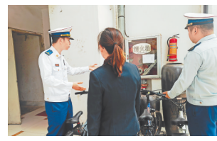
防火干部指导消除火灾隐患。