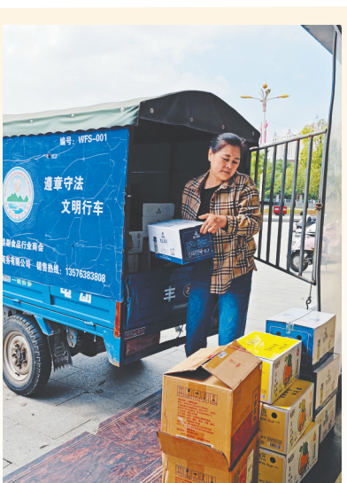
物流配送员有序停车配货。