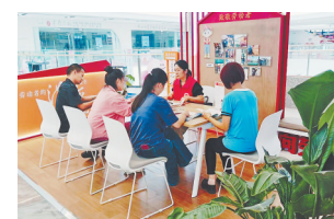
群众在“红色客厅”进行咨询。