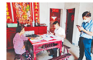
工作人员为村民办理“守护保”。