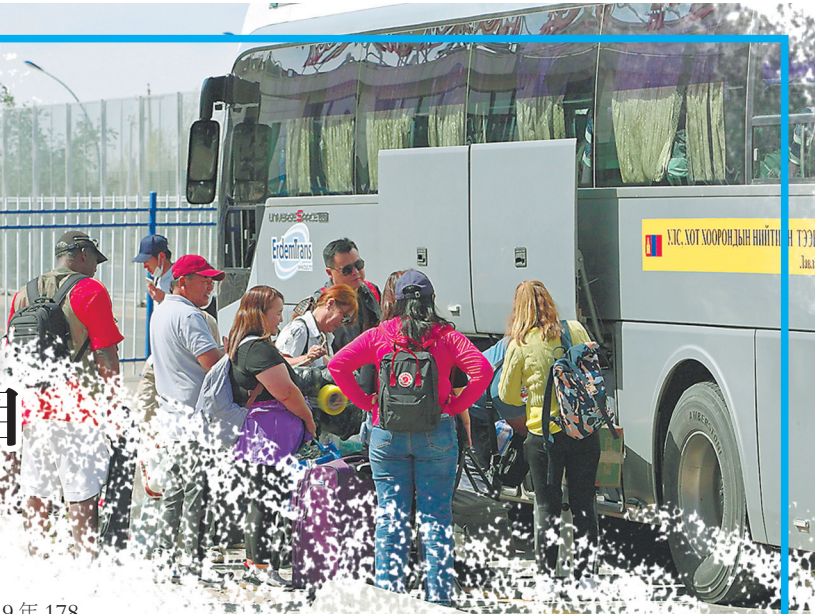
等待进入扎门乌德口岸旅客通道的旅客。