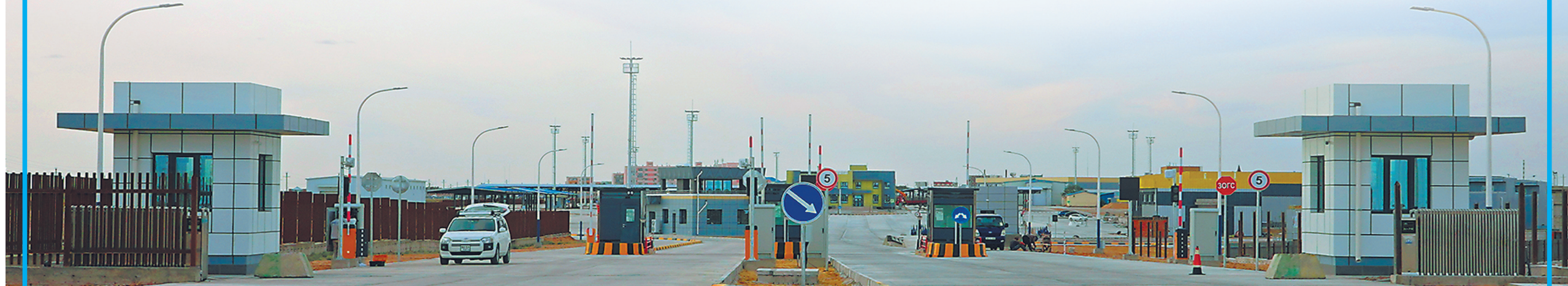
扎门乌德口岸货运出入口。