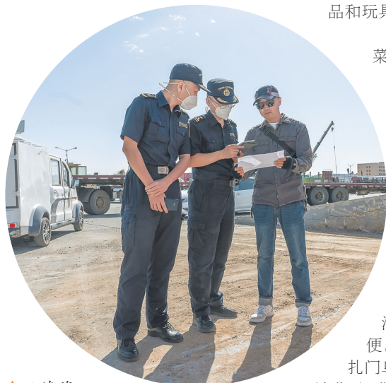
▲二连海 关工作人员在监管 场地执行公务。

做一个项目就交一个朋友。中蒙山水相连、民心相通，双方以项目为媒，促进友好交流，为共建和平共处、守望相助、合作共赢的两国命运共同体而努力，推动高质量共建“一带一路”。