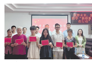
捐资活动现场。 继续发挥广泛联系各方的优势，争取为更多需要帮助的人送去关爱。

本报讯(易永艳)“感谢区新联会的捐助，我今后好好学习，做一个对社会有用的人。”近日，南昌市青山湖区新联会开展“筑梦未来爱心助学”活动，受资助的范同学说。活动现场，青山湖区新联会为品学兼优的困难学生及家属捐赠3.4万元助学款，并为学生提供就业实习岗位。青山湖区新联会将