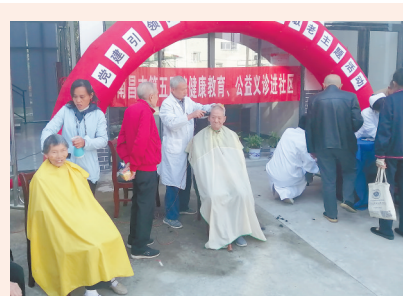
▲志愿者为青云谱区塔子桥社区的老人免费理发。