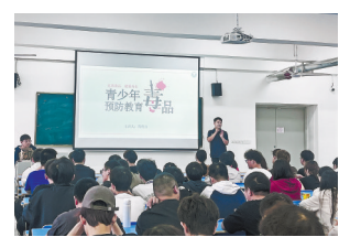
禁毒知识讲座。 品仿真样品，介绍毒品的种类及特征等。学生们表示，此次活动让他们认识到毒品的危害，提高了防毒能力和拒毒意识。

本报讯(全媒体记者付强 通讯员张继国)“不可思议，原来，跳跳糖、奶茶、可乐、果冻也可能是伪装打扮的毒品。”日前，华东交通大学学生小李告诉记者，进贤县公安局缉毒大队联合进贤县626服务中心、赵埠派出所深入该校开展禁毒宣传教育活动，不仅向青少年讲解禁毒法律法规，还重点讲解了新出现的含依托咪酯、美托咪酯成分电子烟的危害，展示鸦片、大麻、摇头丸等毒