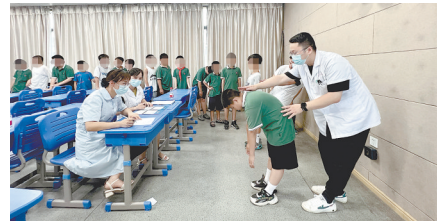
医务人员给学生做脊柱检查。

“我国青少年脊柱侧弯发病率为3%至5%，我在参与公益筛查时，发现新余的中小學生脊柱侧弯发病率远超全国平均值。”章小稳向记者介绍，脊柱侧弯是继肥胖、近视之后，危害我国青少年健康的第三大疾病。目前我国中小學生患脊柱侧弯的人数已经超过500万，并且还在以