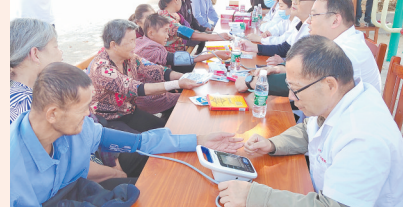
▲新建区大塘坪乡敬老院义诊现场。