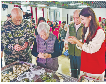
省福彩中心工作人员和老人包饺子。

本报讯(全媒体记者陈璋)10月19日至20日，江西省福彩中心邀请媒体记者一行走进上饶弋阳县、铅山县开展“福彩公益行，走进养老院”主题活动，在重阳节之际，为老人们送爱心。