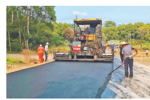
道路改造施工现场。 近日，该工程完工通车，村民出行难问题得到有效解决。

本报讯(全媒体记者洪怀峰)“修好了路，出门再也不用晴天一身灰，雨天一身泥了。”高安市瑞州街道赤溪村村民们纷纷为村里做的实事点赞。据悉，赤溪村到刘家村原有的水泥路面因年久失修坑洼不平，村民出行很不方便。赤溪村两委积极回应群众诉求，争取资金97万元，对这条道路进行了升级改造。