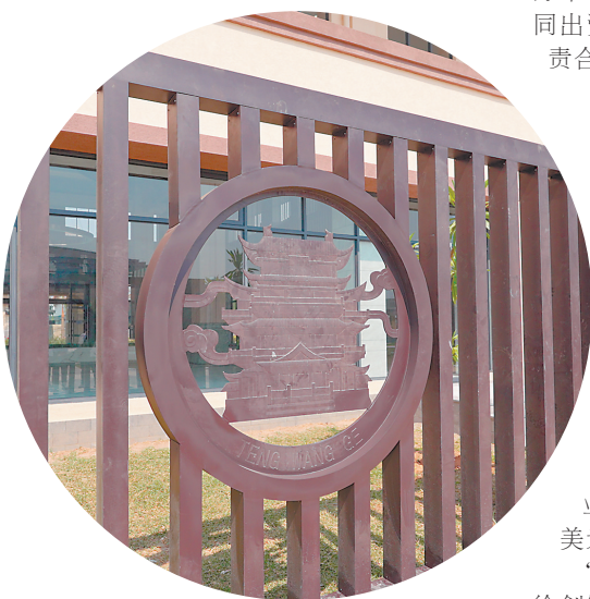
▲合作区办公楼装饰上有许多江西元素。

共建、共享，合作区在为赞比亚工业化进程注入新动能的同时，也为当地群众带来了更值得期待的未来。