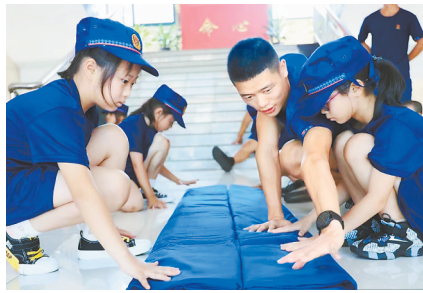
孩子们体验消防救援队的生活。

“火焰蓝”助学基地还聘请了2名生活老师照顾困难家庭孩子的日常生活。莲花县消防救援大队每天安排一名消防