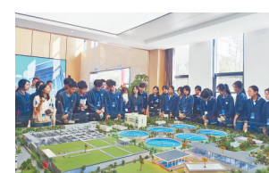
同学们在公司实地参观。

本报讯(易永艳)“我们深刻认识到污水处理不易,要养成绿色低碳的习惯。”近日,南昌市第十三中学高二年级的同学们来到江西洪城城北污水处理厂,探秘“一滴污水的旅程”,这次沉浸式课堂让他们体会到,要用实际行动带动更多的人共同守护碧水蓝天。当天,工作人员还通过实验,对污水处理流程作细致讲解,加深了同学们对污水变清过程的认识,激发了同学们参与环境保护的热情。