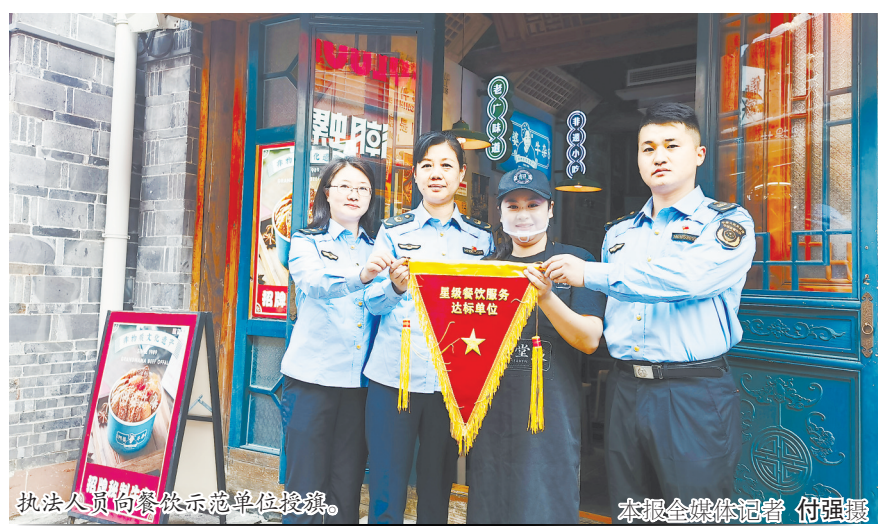
执法人员向餐饮示范单位授旗。