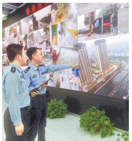
交警查看何坊西路附近路况。

交警部门经调研发现,该路段拥堵方向以东进口为主,通行流量约占路口总流量的40%,车流来源于洪都高架东往西下匝道方向,拥堵严重时,车流从东进口排