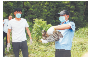
将伤愈的野生动物放归自然。

本报讯(全媒体记者徐黎明)经过科学治疗和精心饲养,这批野生动物已恢复健康,具备野外生存条件。日前,在乐平市洪岩镇历山小坑村,乐平市林业局野保站联合景德镇市林业局资源保护中心将一批国家重点保护野生动物放归自然。乐平市林业局全面推进林长制工作,通过加强林长巡林巡查机制,今年共救助受伤、病危的国家二级保护动物白鹇6只、猫头鹰8只、猕猴1只、黄嘴角鸮1只、夜鹭3只,省级重点保护野生动物池鹭、白鹇等6只。