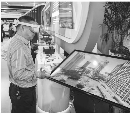
10月26日,在株洲国际会展中心,观众穿戴VR设备体验利用北斗技术辅助建模的地图仿真模型。

10月26日,第二届北斗规模应用国际峰会在湖南株洲国际会展中心开幕。峰会展示并讨论北斗重大成果、规模应用成效,未来前景展望等内容,推动北斗规模应用市场化、产业化、国际化发展。