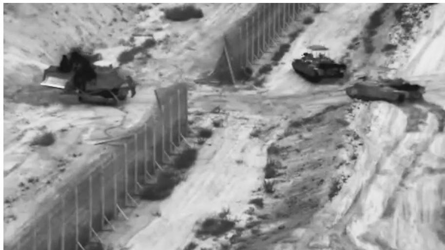
这张从以色列国防军发布的视频中截取的照片显示,10月26日,以军在加沙地带北部开展行动。

巴勒斯坦加沙地带卫生部门26日发表声明称,以色列军队袭击加沙地带已造成7028人死亡,14844人受伤。