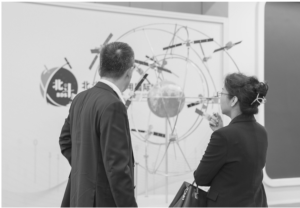
10月26日,在株洲国际会展中心,观众在观看北斗系统组网模型。