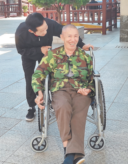
工作人员帮助老人试用轮椅。

本报全媒体记者 陈璋 邮箱:65204228@qq.com 电话:0791-86847355