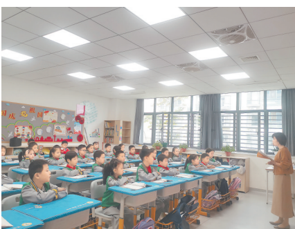
孩子们在改造后的教室上课。