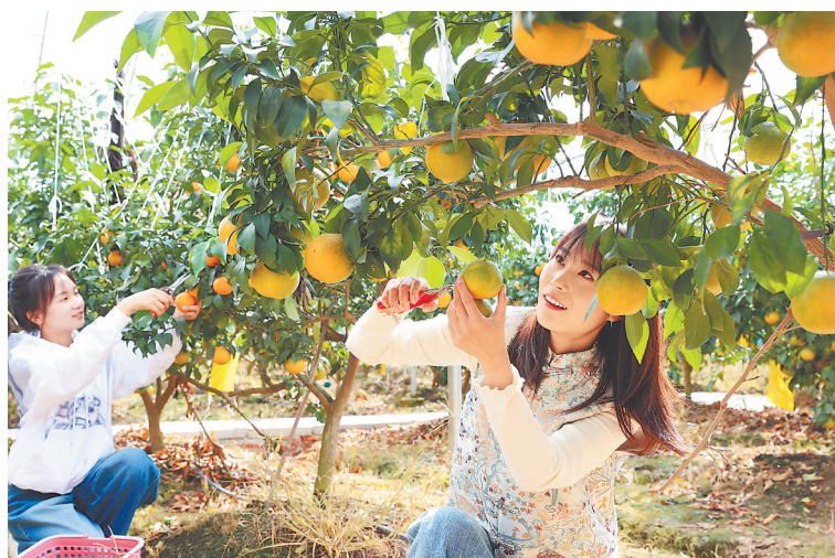
11月6日,在万年县上坊乡红美人果业基地,游客正在体验采摘乐趣。万年县深入贯彻落实习近平总书记考察江西重要讲话精神,引导各乡镇立足实际,努力把生态资源转化为产业优势,通过“公司+基地+农户”模式,带动当地农民增收,促进乡村振兴。

为把习近平总书记考察江西重要讲话精神落到实处,省文联对全省文联工作作出具体部署,在“江西文艺”微信公众号、江西文艺网开设“江西文艺界学习贯彻习近平总书记考察江西重要讲话精神”专栏。(下转第3版)