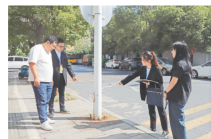
工作人员检查路灯情况。

据了解，在朝新路前期改造过程中，施工单位未将路灯管线预埋，导致该处路灯长期不亮。对此，街道纪检监察工委立即督促街道城管办组织人员，对辖区道路