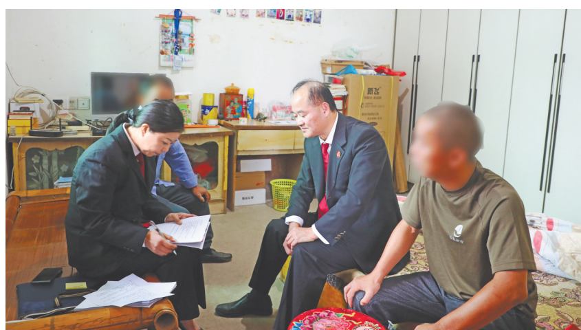
西湖区法院法官在走访申请司法救助的困难家庭。