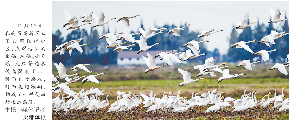
11月12日,在南昌高新区五星白鹤保护区,成群结队的白鹤、灰鹤、小天鹅、大雁等越冬候鸟聚集于此,时而觅食嬉戏,时而展翅翱翔,构成了一幅美丽的生态画卷。