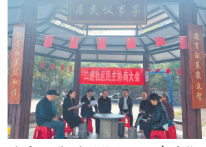
徐家坊街道的“居民议事亭”。 治理难题,着力打通服务群众“最后一米”。今年以来,“居民议事亭”接待群众600余人次。

本报讯(全媒体记者陈璋)日前,南昌市青云谱区徐家坊街道综治中心(一站式矛盾纠纷联合调处中心)升级完毕投入使用。该中心以让群众“最多跑一次”为出发点,整合街道便民服务中心办事窗口,融合综治、信访、民政等资源,着力构建多元共治的“大信访”“大联调”格局。此外,该街道在社区打造“居民议事亭”,充分了解和掌握社情民意,探讨解决