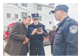
民警上门宣讲反诈知识。 措施。同时,发动社区干部、网格员、物业人员、志愿者等加入反诈宣讲队,全方位营造反诈宣传声势。

本报讯(易永艳 通讯员余非)为有效压降电信网络诈骗等影响群众切身利益的突出警情,今年以来,黎源县公安局110指挥中心组建“警情播报团”常态化走进社区,上门发放防范电信网络诈骗宣传手册,帮助群众下载安装“国家反诈中心”手机软件,开展面对面、渗透式、滴灌式反诈宣传。召集老年人开茶会,讲解养老诈骗、养生保健品诈骗等常见诈骗方式以及防范