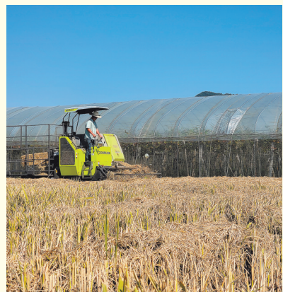
秸秆打捆机正在作业。

乐平市被誉为“江南蔬菜之乡”,当地主要农作物有水稻、油菜、花生、甘蔗、薯豆类等。去年,该市主要农作物播种面积113.06万亩,秸秆年产生量42.92万吨。