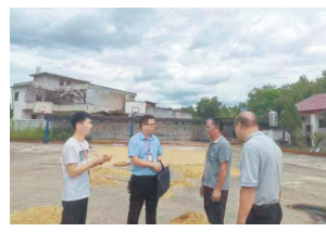
干部在村里了解情况。 题线索2条,提醒谈话5人,发出监察建议书2份,确保群众救助资金不被侵占冒领、截留挪用。

本报讯(全媒体记者付强)“漏发的粮食补贴到手了。”日前,会昌县站塘乡山坝村刘先生告诉记者,由于村干部疏忽,导致他漏发了一部分粮食补贴,好在站塘乡纪委及时发现这一问题,协调有关单位重新足额、准确地发放到农户手中。今年以来,站塘乡纪委深入村组一线走访,聚焦粮食补贴、乡村振兴政策落实等问题。截至目前,乡纪委梳理出问