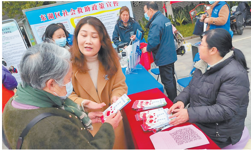
人社局工作人员在进行社会救助政策宣传。

本报全媒体记者 蔡颖辉 邮箱:48505265@qq.com 电话:18679958802