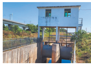
水利设施维修好了。 万元维修资金。近日,水利设施维修工程完工,廖坊水库的水流到了松湖村的田间地头,解决了2000多亩水田用水问题,化解了群众因为用水而引发的矛盾纠纷。

本报讯(全媒体记者侯艺松)近日,抚州市东乡区邓家乡松湖村村民向江西新闻客户端“党报帮你办”栏目反映,在乡里各部门协同下,解决了本村水田用水问题。据悉,去年10月,在邓家乡人大代表接待选民活动中,有人反映本村应从小塘水库引入松湖村的水因水利设施损坏无法到达。对此,邓家乡人大主席团立即向乡党委进行汇报和乡政府交办,相关负责人多次与抚州市廖坊水利工程项目管理部门协调,落实了60