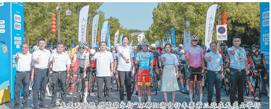
“龙虎天下绝·丹山碧水”环鄱阳湖自行车赛第三站在龙虎山举行