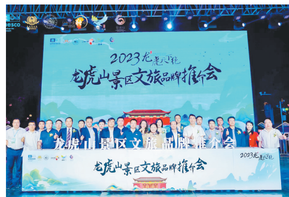
龙虎山景区文旅品牌推介会走进郑州