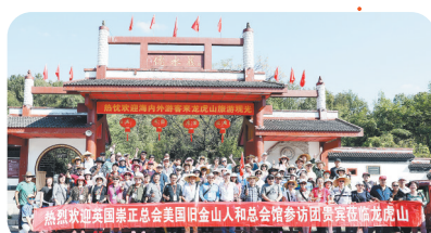
海外游客喜游龙虎山