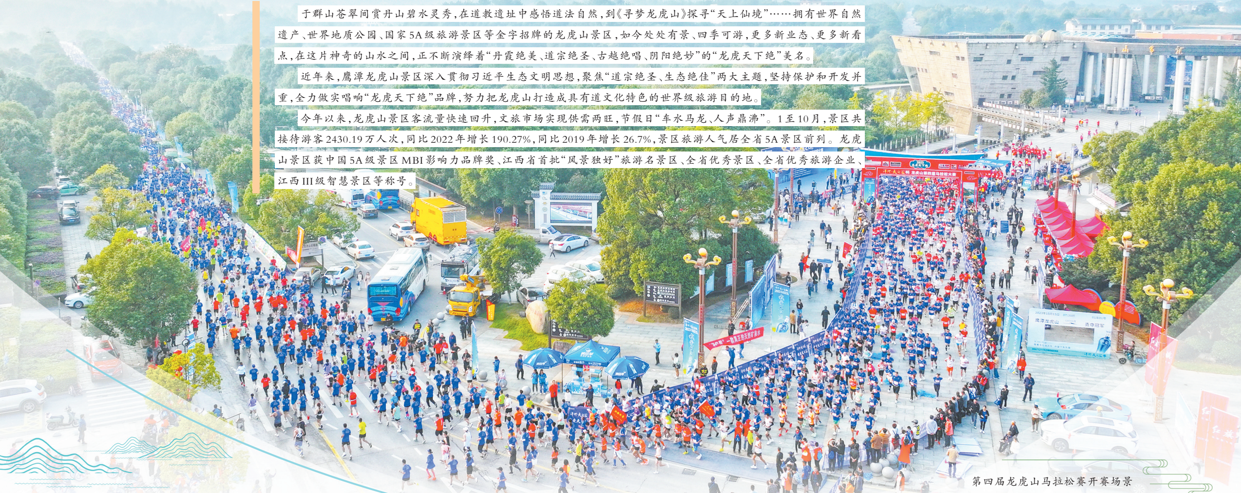
第四届龙虎山马拉松赛开赛场景

于群山苍翠间赏丹山碧水灵秀,在道教遗址中感悟道法自然,到《寻梦龙虎山》探寻“天上仙境”……拥有世界自然遗产、世界地质公园、国家5A级旅游景区等金字招牌的龙虎山景区,如今处处有景、四季可游,更多新业态、更多新看点,在这片神奇的山水之间,正不断演绎着“丹霞绝美、道宗绝圣、古越绝唱、阴阳绝妙”的“龙虎天下绝”美名。 近年来,鹰潭龙虎山景区深入贯彻习近平生态文明思想,聚焦“道宗绝圣、生态绝佳”两大主题,坚持保护和开发并重,全力做实唱响“龙虎天下绝”品牌,努力把龙虎山打造成具有道文化特色的世界级旅游目的地。 今年以来,龙虎山景区客流量快速回升,文旅市场实现供需两旺,节假日“车水马龙、人声鼎沸”。1至10月,景区共接待游客2430.19万人次,同比2022年增长190.27%,同比2019年增长26.7%,景区旅游人气居全省5A景区前列。龙虎山景区获中国5A级景区MBI影响力品牌奖、江西省首批“风景独好”旅游名景区、全省优秀景区、全省优秀旅游企业、江西III级智慧景区等称号。