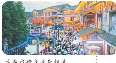
古越水街点亮夜经济