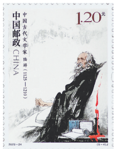
纪念邮票《中国古代文学家(五)——陆游》