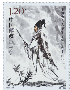
纪念邮票《中国古代文学家(五)——苏轼》