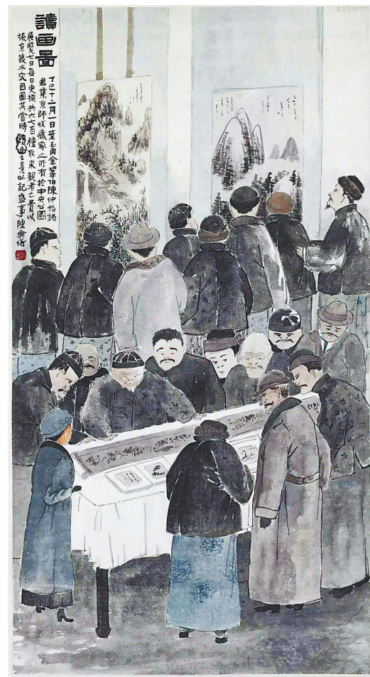
《读画图轴》陈师曾绘

有人说:“如果没有陈师曾,20世纪初期的北京画坛一定会黯淡许多”。从中可见其在当时画坛的地位。在去年中国嘉德春季拍卖会上,《息翁玩具图》这件有着17处著录的拍品,拍出了126.5万元的高价。这无疑是今人对陈师曾创作的一种认可。