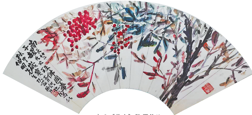
扇面《花卉》陈师曾绘

他回南京省亲,伺候生病的继母俞明诗。继母病逝后,身体孱弱的陈师曾冒雨送葬,因悲伤过度,旧病复发,一个月后辞世,年仅48岁。同年9月,北京文艺界为其在江西会馆举行追悼会。梁启超在致悼词中称:“师曾之死,其影响于中国艺术界者,殆甚于日本之大地震。地震之所损失,不过物质,而吾人之损失,乃为精神。”吴昌硕的题字是“朽者不朽”,这是对陈师曾艺术人生的最高评价。齐白石则写诗哭师曾,说如果可以换回陈君的生命,他宁愿拔剑了结自己性命:“哭君归去太匆忙,朋友寥寥心益伤。安得故人今日在,尊前拔剑杀齐璋。”