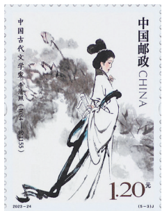
纪念邮票《中国古代文学家(五)——李清照》