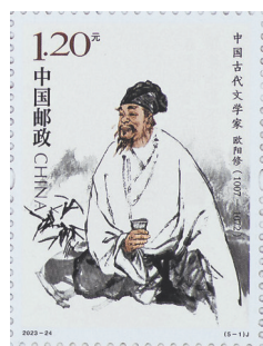
纪念邮票《中国古代文学家(五)——欧阳修》

这5位文学家中,“待遇”最高的是辛弃疾。举行邮票首发式纪念他的地方,除了江西铅山,还有山东济南。李清照与辛弃疾均为济南人,清代著名学者王士禛称李清照(号“易安居士”)与辛弃疾(字“幼安”)为“济南二安”。