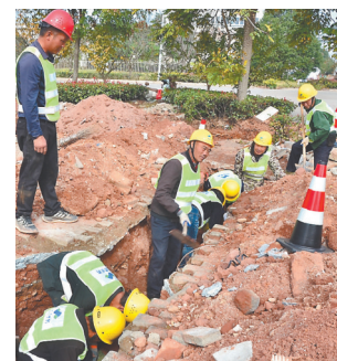
勘察设计施工与验收通水环节同步进行。

据了解,为了让用户更便捷地办理用水报装业务,弋阳润泉供水有限公司对办事流程进行了压缩,将报装申请与通水环节合并。通过前置服务,将勘察设计施工与验收通水环节同步进行,将原时限3个工作日缩短至1