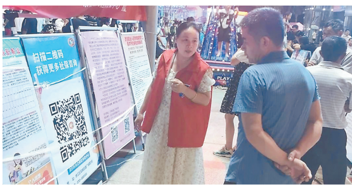
鹰潭市余江区开展“社保服务进万家”政策宣传活动。

市社保经办机构城乡居民养老保险业务负责人和业务骨干进行现场培训,全省115个县级社保经办机构对1762个乡镇街道的7193名城乡居民养老保险经办人员进行业务培训,进一步丰富各级经办人员的业务知识,提高服务水平。