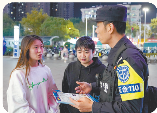
11月14日,新余市公安局民警在渝水区恒大商圈开展反诈骗宣传活动,为市民普及常见的诈骗信息和手段,提高市民的防范意识和识别能力。

第二批主题教育开展以来,新余市牢牢把握“学思想、强党性、重实践、建新功”的总要求,始终坚持把实现好、维护好、发展好广大人民根本利益作为出发点和落脚点,深入群众、贴近群众、服务群众,把惠民生、暖民心、顺民意的好事实事办到群众心坎上,确保主题教育成效让群众看得见、摸得着。