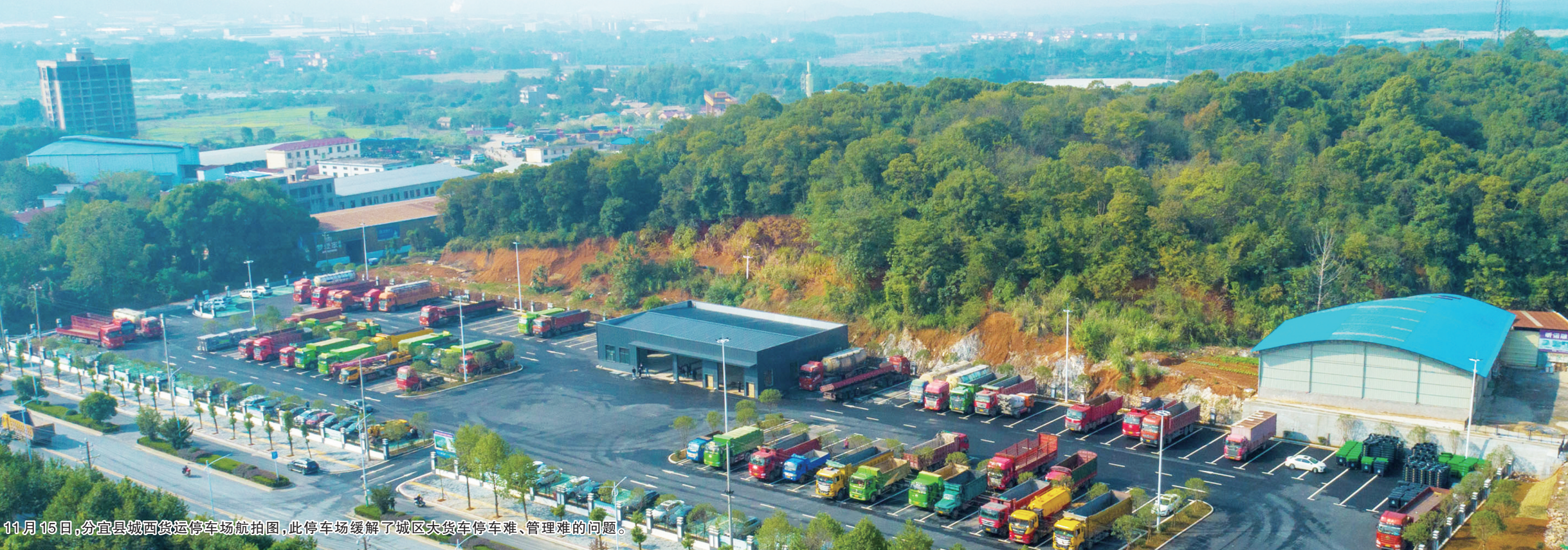
11月15日,分宜县城西货运停车场航拍图,此停车场缓解了城区大货车停车难、管理难的问题。