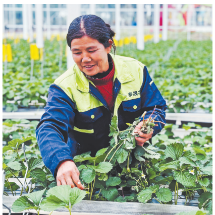
村民在空中草莓园务工。