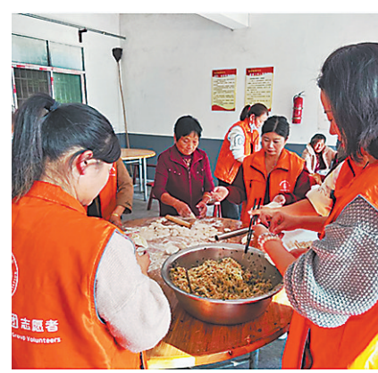
志愿者在敬老院包饺子。

前不久,江西紫华包装有限公司在锣鼓声中正式生产。这家投资1亿多元的企业,从签订合同到试生产,再到正式生产,前后仅用了70天时间,创下乐平招商引资企业的新速度。而这一切,双田镇“妈妈团”的全方位服务功不可没。