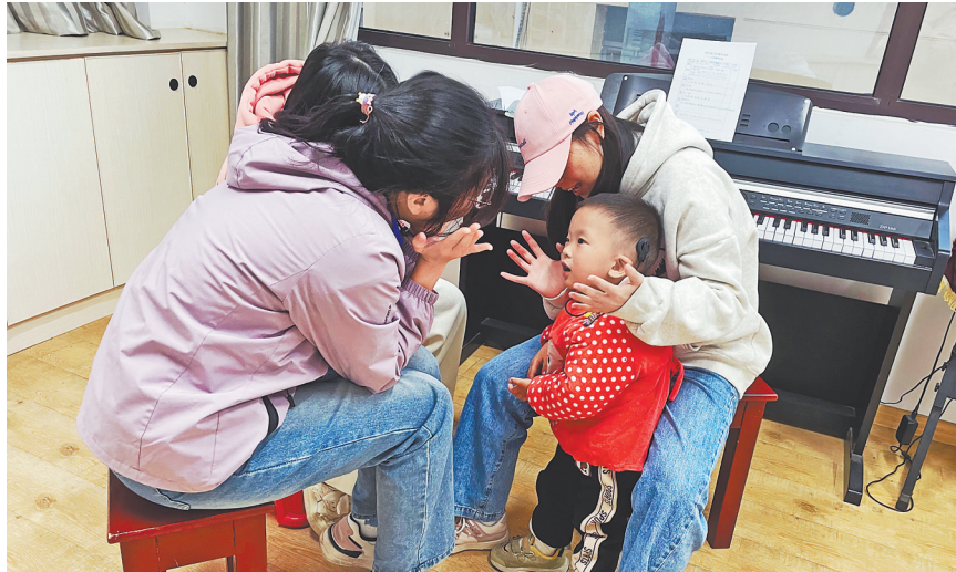
志愿者正带着听障儿童唱歌。