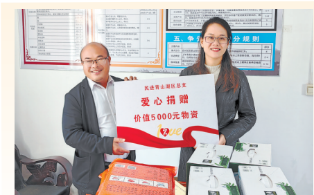
▲民进青山湖区总支相关负责人向岭南村捐赠爱心物资。