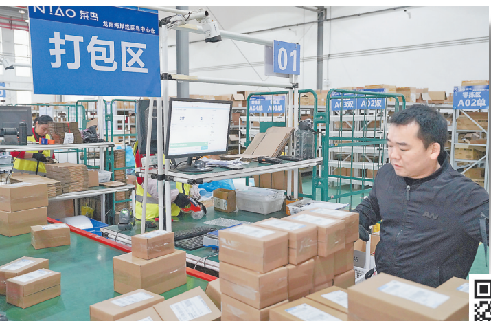
龙南保税物流中心(B型)菜鸟中心仓内,工人忙着打包、分拣来自全球各地的商品。