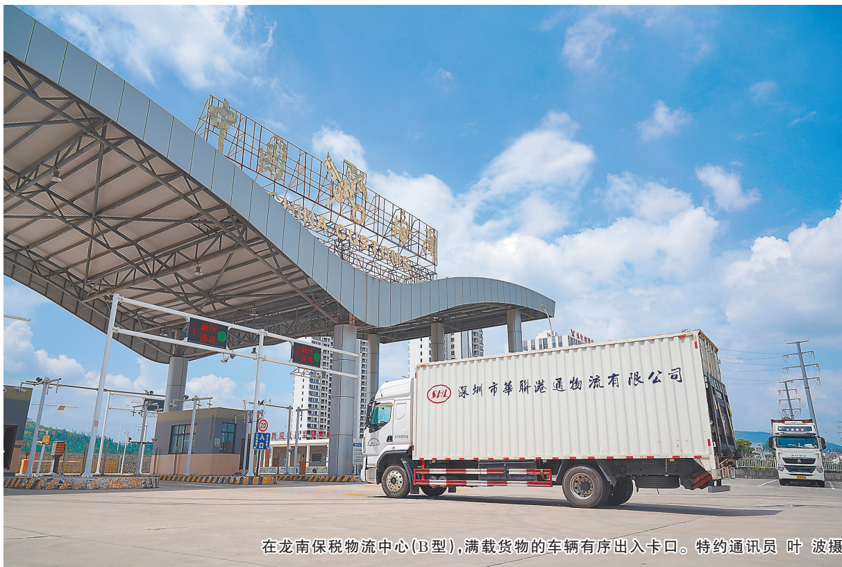
在龙南保税物流中心(B型),满载货物的车辆有序出入卡口。

龙南市是江西“南大门”,毗邻广东,人口约34万。这个内陆小县,短短几年间,成为江西省唯一全业态开通跨境电商1210、9610、9710、9810业务的县级城市,跨境电商1210业务交易额连续三年列全省前三。龙南市是如何抢抓机遇,“跨”入蓬勃生长时代?目前跨境电商产业发展现状如何,未来又将怎样发展?连日来,记者深入龙南市进行探源。