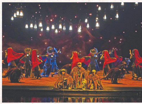
舞台剧《长征第一渡》剧照

关启动，轰隆隆的洪水倾泻，坐在前排的观众，只觉得浪花飞溅扑面，看着眼前在铁索上飞渡的红军战士，震撼之余身心“炸裂”，宛如自己也参与到那令人热血沸腾的战场。