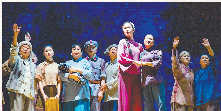
舞台剧《长征第一渡》剧照

大型红色文旅史诗的舞台诗画剧《长征第一渡》在中央红军长征集结出发地于都一经上演，便收获了大量好评。