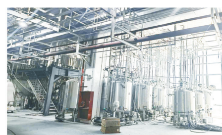
在赣江中药创新中心开展联合研究的萃取设备