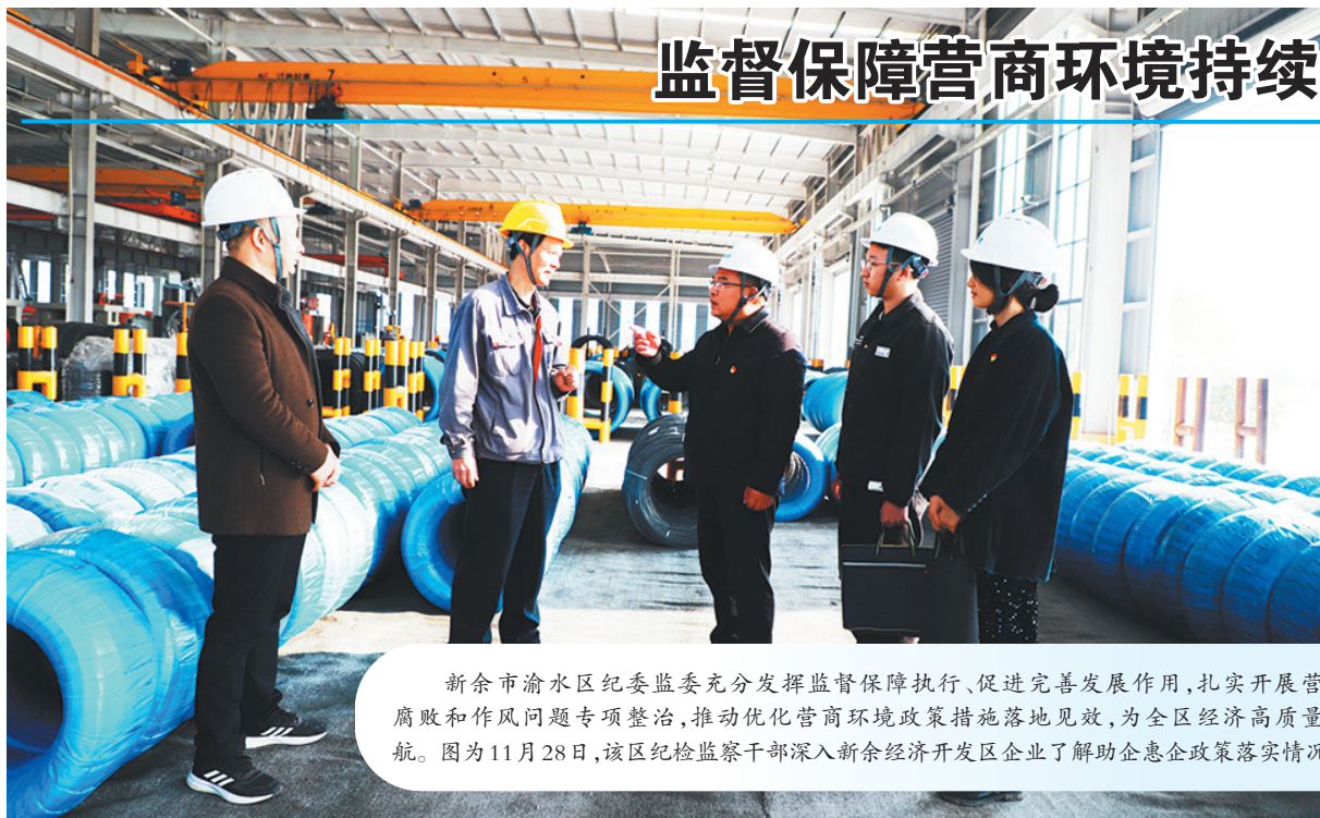
新余市渝水区纪委监委充分发挥监督保障执行、促进完善发展作用,扎实开展营商环境领域腐败和作风问题专项整治,推动优化营商环境政策措施落地见效,为全区经济高质量发展保驾护航。图为11月28日,该区纪检监察干部深入新余经济开发区企业了解助企惠企政策落实情况。