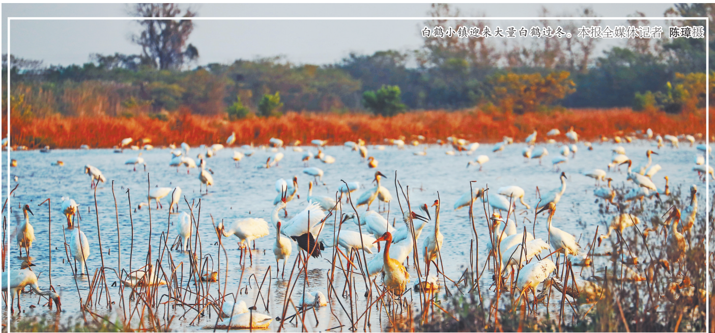
白鹤小镇迎来大量白鹤越冬。

在“你回答,我送头盔”互动环节,民警针对辖区道路交通实际情况,随机出题,老人举手答题。交警刚出完题,一名老人就准确说出了答案。“答案正确,奖励头盔一顶。”现场响起了热烈的掌声。当天,民警共发放宣传资料200余份,赠送安全头盔50顶。