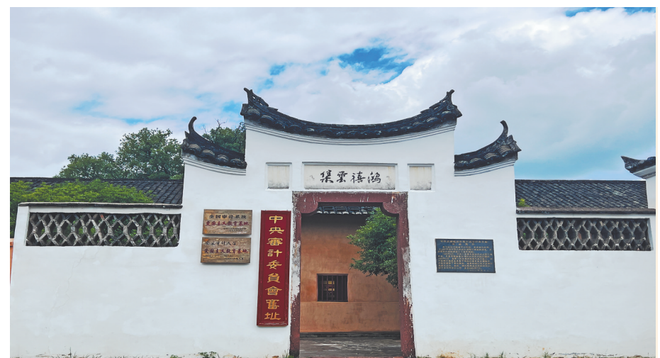
中华苏维埃共和国中央审计委员会旧址

坚持自我革命，打造经济监督“特种部队”。自我革命是开展红色审计的必然要求。江西深入贯彻习近平总书记提出的审计“三立”重要要求，勇于自我革命，着力打造忠诚干净担当的高素质专业化审计干部队伍。坚持把临时党支部建在审计组上，依托红色审计资源开展党性教育，引导审计干部锤炼绝对忠诚、绝对过硬、绝对可靠的政治品格，打造“国家审计”金字招牌。