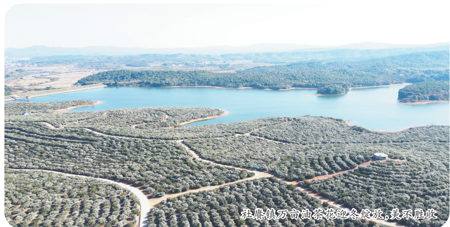
在厚镇万亩油茶基地冬管验收,鼓劲不歇收