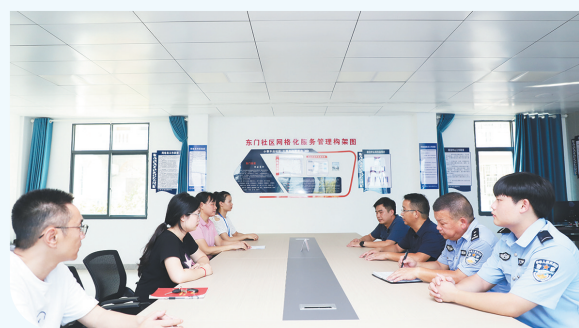
城市社区党工委东门社区召开“1+5+X”联系协商会