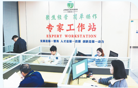
江西净菜食品有限公司与江西农业大学共建专家工作站

铸造留才巢穴。建立人才驿站、成立驻外人才工作联络站,发挥信息赋能优势,推动产教融合“线上+线下”联动服务更加精细化。同时,举办“人才夜市”暨高校毕业生招聘会,创建云招聘和线上直播带岗引才新模式,累计服务企业单位278家次,提供12126个就业岗位。精挑细选、选优配强挂点干部联系人,服务全覆盖,了解人才住房保障、医疗保险、家属就业、子女就学等各方面需求,做好动态跟踪服务,营造尊才、爱才、敬才、用才的良好社会氛围,实现人才不断积聚。