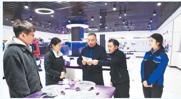
引进人才创办的江西和创光电股份有限公司,自主研发出柔性折叠显示屏玻璃