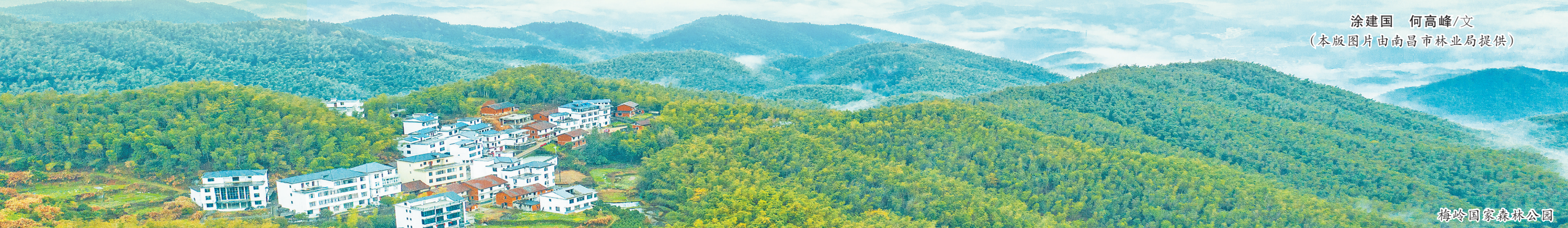
梅岭国家森林公园