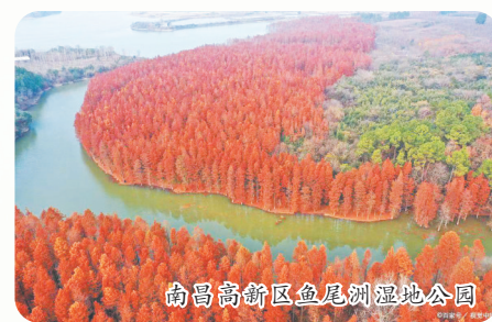
南昌高新区鱼尾洲湿地公园