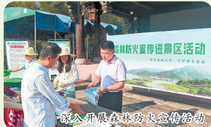
深入开展森林防火宣传活动