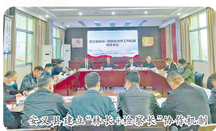
安义县建立“林长+检察长”协作机制

南昌市总林长以身作则,多次深入巡林护林一线,现场调度解决问题,“头雁效应”逐步显现。5月14日,省级林长、市级总林长在梅岭巡林时,发现马口村部分区域存在山体裸露情况,当即要求整改复绿,并要求举一反三,加大巡查巡护力度。在南昌市总林长的调度下,马口村山体很快得到修复。今年以来,市、县两级林长共签发总林长令17次,开展巡林182次,协调解决了93个森林资源保护发展问题。