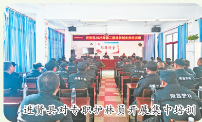
进贤县对专职护林员开展集中培训