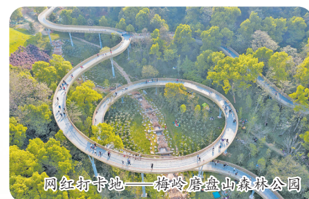
网红打卡地——梅岭磨盘山森林公园

冬日暖阳下,走进南昌的森林公园,走在乡村道路上,人们会惊喜地发现,红色的水杉、黄色的银杏、绿色的松柏等相互交织在一起,色彩斑斓,宛如一幅美丽的生态画卷,绿色正成为幸福生活的动人底色。