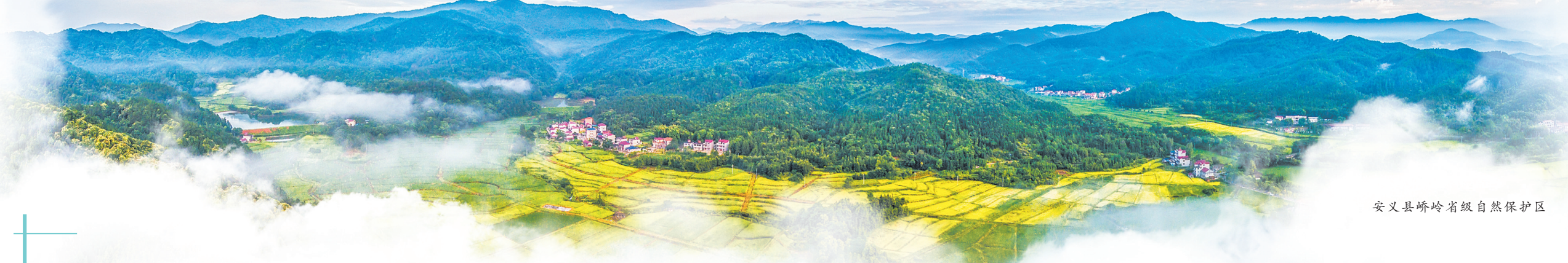
安义县峤岭省级自然保护区

南昌市,地貌概况为“二山三水四分田,一分道路和庄园”,森林面积185.75万亩,林地面积215.78万亩,有国家、省级生态公益林面积71.15万亩,古树名木4214株,各类自然保护地26处,湿地面积229.95万亩。辖区内的鄱阳湖水域面积约占鄱阳湖水域总面积的三分之一,每年在此越冬的候鸟达212种,18万羽,是全球75%以上东方白鹤和98%白鹤的越冬栖息地。