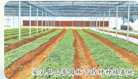
安义县山香圆林下药材种植基地