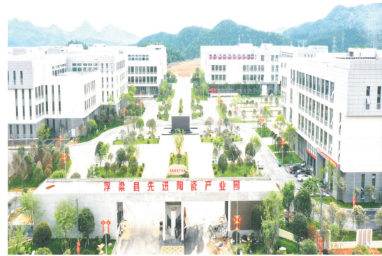
浮梁县先进陶瓷产业园