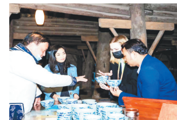
外国友人与非遗文化传承人进行陶瓷文化交流