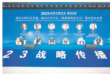
2023战略传播论坛现场

下一步,景德镇市将全力推动陶瓷文化保护传承走深走实,全力推动陶瓷产业做大做强,全力推动陶瓷交流互学互鉴,为世界优秀文化交流作出更大贡献,把“千年瓷都”这张亮丽的名片擦得更亮。