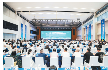
2023“丝绸之路城市文化和旅游发展”国际论坛现场