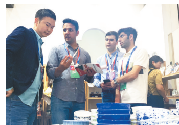
瓷博会国外客商与陶瓷参展商交流

目前,全市已初步形成以陶阳里、陶溪川为代表的文化游,以陶瓷博物馆、御窑博物馆为代表的展馆游,以陶博城、名坊园为代表的购物游,以高岭中国村、“CHINA印象”为代表的沉浸式游,以直升机科技馆等为代表的研学游,一批特色景区、文旅IP火热“出圈”。同时,进一步提升“十五景、三宴、三剧”等旅游产品的品牌效应和经济效益,全力打造“千馆之城”,全域唱响“夜珠山”文旅消费品牌,文旅产业迎来了厚积薄发、加速爆发的喜人局面。