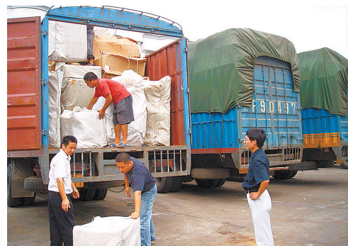
2005年10月，广昌物流从业人员正在装货。（资料图）