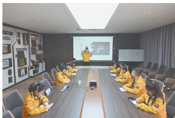
江苏运斯达物流供应链管理有限公司办起了自己的物流“商学院”。图为2023年12月4日，公司员工正在学习数智物流的相关知识。