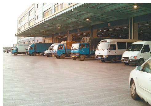
2006年4月，广昌人在上海开办的一家物流公司。（资料图）