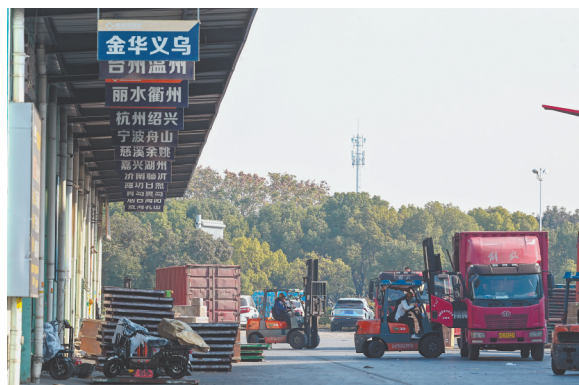
2023年12月3日，江苏省无锡市锡山区锡北镇正广通物流基地，装运货物的车辆络绎不绝。通过亲帮亲、邻帮邻，基地聚集了许多广昌物流从业人员。