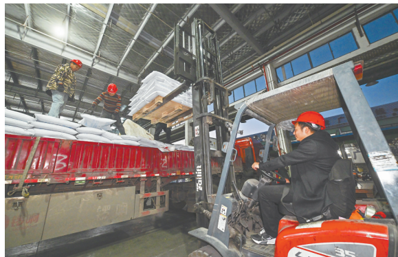
2023年12月2日，无锡正广通物流基地，广昌物流从业人员正在装货。