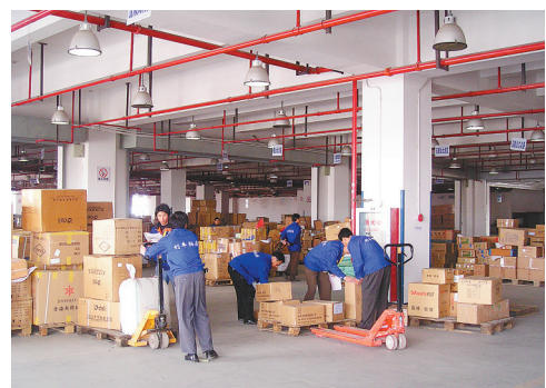
2006年4月，上海的广昌物流从业人员正在工作。（资料图）