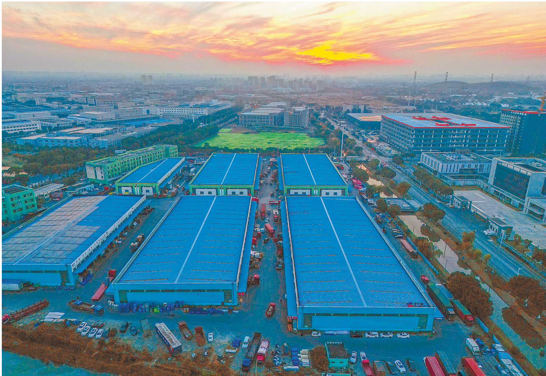
2023年12月2日傍晚，江苏无锡正广通物流基地进入最繁忙的装货发车时段。这里每天有400多辆货车出入，货物吞吐量1万多吨。

目前，在全国范围内，广昌人创办的物流企业有5000余家，物流从业人员6万余人，形成了覆盖全国的物流产业网络，年营业额超千亿元。“中国物流第一县”品牌带动了一批产业，带富了一方百姓。