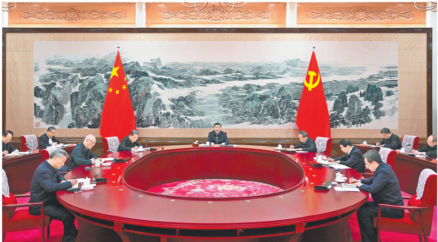
12月21日至22日,中共中央政治局召开学习贯彻习近平新时代中国特色社会主义思想主题教育专题民主生活会,中共中央总书记习近平主持会议并发表重要讲话。

新华社北京12月22日电 中共中央政治局于12月21日至22日召开学习贯彻习近平新时代中国特色社会主义思想主题教育专题民主生活会,聚焦学思想、强党性、重实践、建新功总要求,对照凝心铸魂筑牢根本、锤炼品格强化忠诚、实干担当促进发展、践行宗旨为民造福、廉洁奉公树立新风具体目标,按照以学铸魂、以学增智、以学正风、以学促干重要要求,联系中央政治局工作,联系带头旗帜鲜明讲政治、带头学懂弄通做实习近平新时代中国特色社会主义思想、带头贯彻党中央决策部署、带头践行宗旨为民造福、带头履行全面从严治党责任等方面的实际,总结成绩,查摆不足,进行党性分析,开展批评和自我批评。