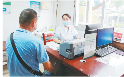
医生开具医保电子处方并上传至江西省医保电子处方中心