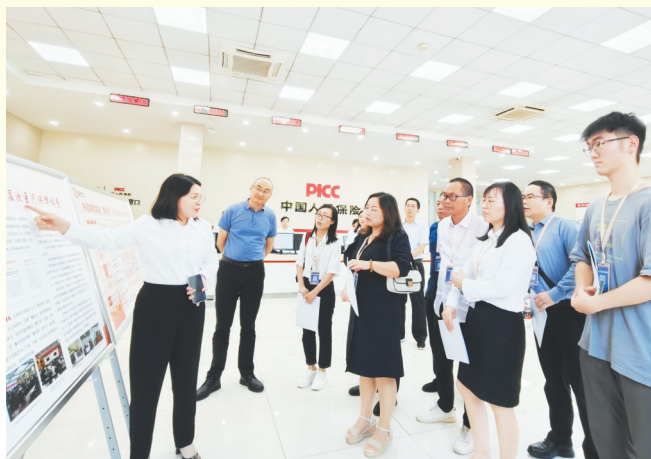
工作人员利用机关开放日向群众代表介绍“惠得保”