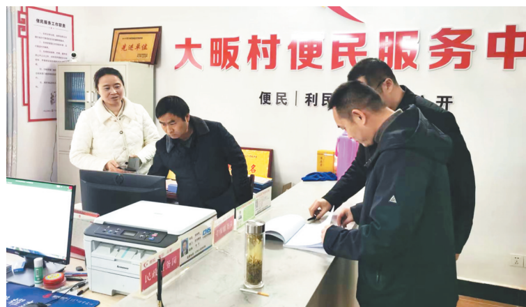
群众在村级便民服务中心办理医保业务