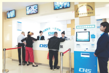
九江学院附属医院医保一体化保障服务中心为群众办理医保业务

没有全民健康，就没有全民小康。医疗保障制度是党和政府的一项民生工程，关系到千千万万人民群众的切身利益。两年来，九江市医疗保障局主动作为，以医保“小切口”服务群众“大民生”。该局紧贴群众健康需求，按照“织密网、增福祉、兜底线、惠民生、可持续”的思路，不断优化完善多层次医疗保障体系，着力解决人民群众后顾之忧，兜牢民生底线，让浔城百姓更有依靠。