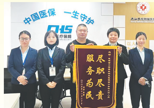
医保一体化保障服务中心工作人员热情服务被点赞