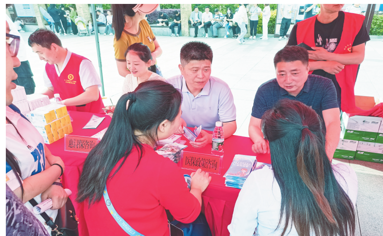
医保局工作人员现场向群众普及基金监管相关法规及提供医保政策解读

今年以来，九江全市“四级经办”累计办件量87万件，其中：乡村两级累计办件量40万件，占全市总办件量45.9%，同比增长8.1%；市县两级累计办件量47万件，占全市总办件量54.1%，同比下降14%。随着一个个医保服务点的设立，医保经办服务真正实现“就近办”“多点办”“快速办”。