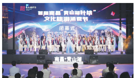
“青山湖针纺”文化旅游消费节