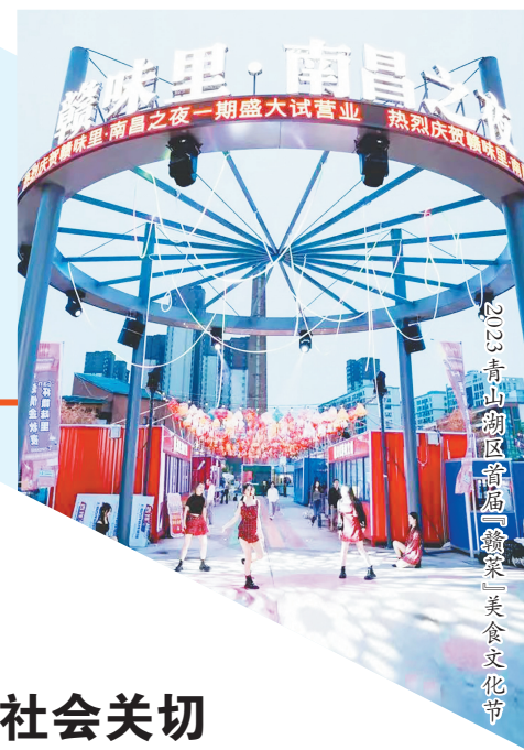
2023青山湖区首届“赣菜”美食文化节